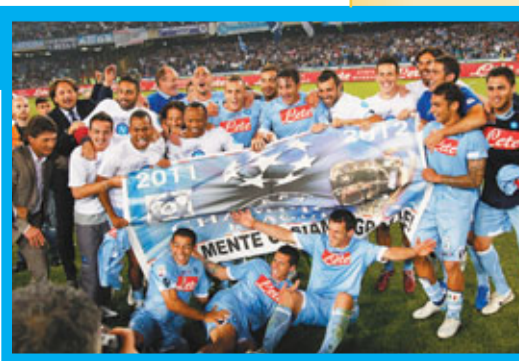
拿玻里上下慶祝踢來屆歐聯。