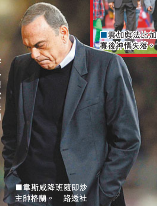
韋斯咸降班隨即炒主帥格蘭。