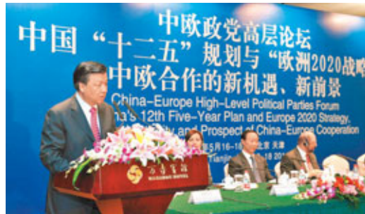
■中宣部部長劉雲山出席「中歐政黨高層論壇」開幕式。