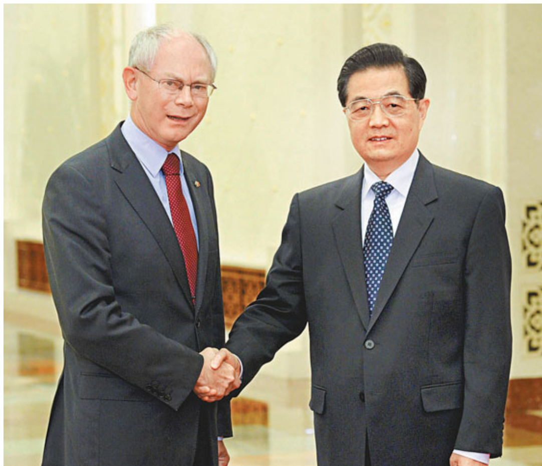
■中國國家主席胡錦濤昨日會見歐洲理事會主席范龍佩，並表示希望歐盟承認中國市場經濟地位；范龍佩則讚揚中國為保持歐元區穩定作出貢獻。

此外，在介紹歐洲一體化建設和經濟形勢時，范龍佩表示，中國為保持歐元區穩定、促進歐洲經濟復甦做出了重要貢獻，歐方對此表示感謝。