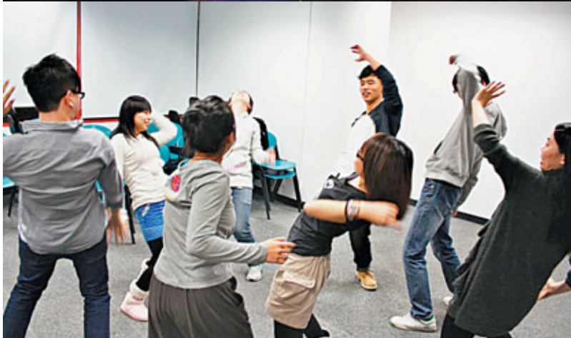
演員們在做隨著音樂擺動身體的練習。