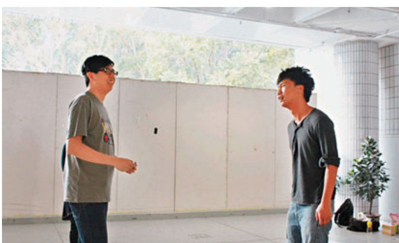
演員們在做即興練習。