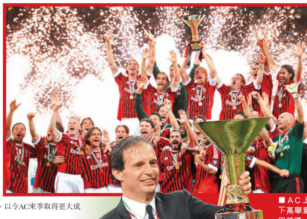
AC上下高舉意甲錦標。

此外，艾歷尼也透露自己去年從卡利亞里過檔AC後，在足球哲學上有了很大的改變。「我來到球隊後，第一時間要求球員為了在場上表現更好，必須要在訓練中更加認真。我很少呼籲球員為球隊而奮鬥，因為他們一直都自覺地這樣做。」最後艾歷尼表示，他希望班主貝盧斯科尼今夏繼續大手筆買人，以令AC來季取得更大成功。