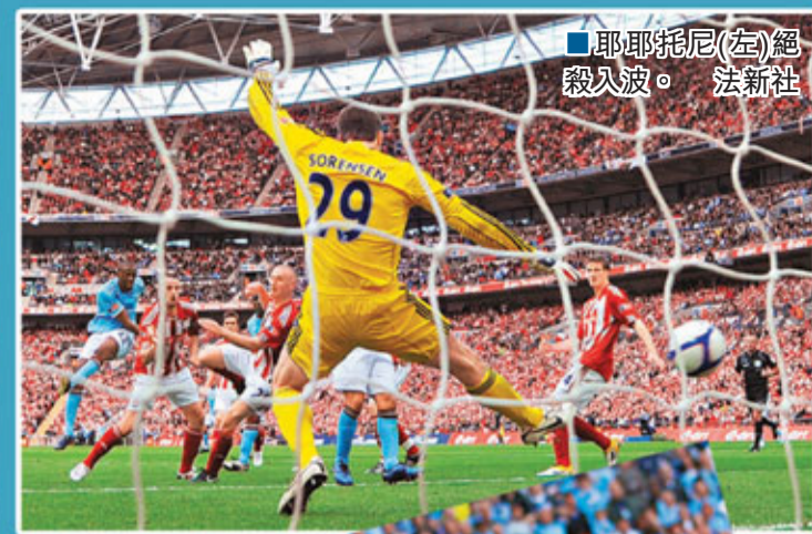
耶耶托尼(左)絕殺入波。