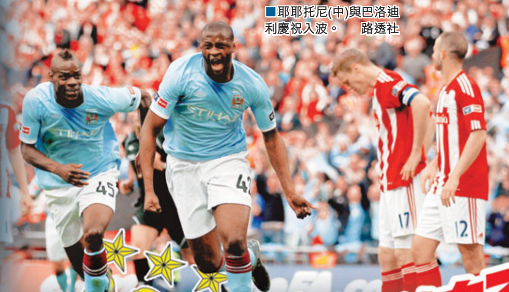
耶耶托尼(中)與巴洛迪利慶祝入波。