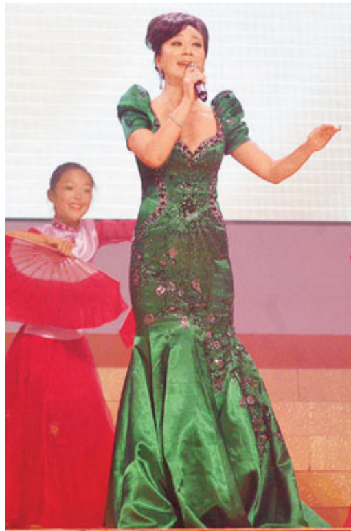
國家一級演員何紓，在匯演中演唱《祖國之戀》。

昨日適逢是藍奕邦33歲生日，現場有不少歌迷送上蛋糕慶祝，阿邦透露七月推出新碟，今次會轉歌路以快歌為主，兼且玩復古造型，屆時會有跳舞，故此現在開始跑步修身，至於大家會否接受他轉形象，笑言預計不到哩！