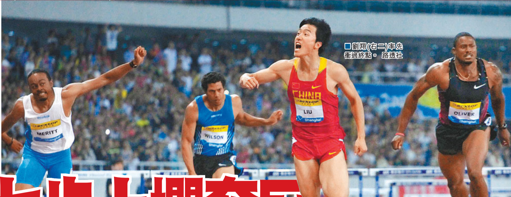
劉翔(右三)率先衝過終點。路透社

香港文匯報訊（記者 章蘿蘭 上海報導）劉翔15日晚在上海首度公開展示秘練三個月的「七步上欄」絕技，果然威力無窮！中國「飛人」出乎意料地以13秒07的成績，一舉擊敗目前狀態極佳的美國名將奧利弗，強勢奪得上海田徑黃金大獎賽冠軍，創造今年世界最好成績。這同時亦是劉翔奧運傷退復出後跑出的最好成績。