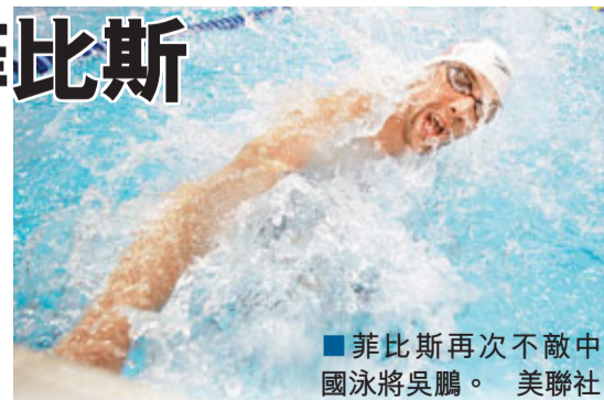
菲比斯再次不敵中國泳將吳鵬。

據新華社華盛頓14日電 中國泳將吳鵬又擊敗了北京奧運會「八金王」菲比斯。美國游泳大獎賽夏洛特站比賽14日進入第三天，在男子200米蝶泳決賽中，吳鵬第二次戰勝菲比斯，奪得該項目的冠軍。在上個月9日進行的美國游泳大獎賽密歇根站比賽中，吳鵬在同一項目上曾贏過菲比斯。那是吳鵬游泳生涯第一次戰勝菲比斯。有泳壇「飛魚」美譽的美國選手菲比斯在過去九年裡，包辦了全部60次200米蝶泳比賽的冠軍，可近兩次比賽他卻連輸兩陣，而且輸給的對手均是吳鵬。吳鵬目前正在美國密歇根安阿伯一家名叫狼獵的游泳俱樂部接受訓練。他上個月奪得200米蝶泳冠軍的成績為1分56秒62，當日他的成績為1分56秒83。