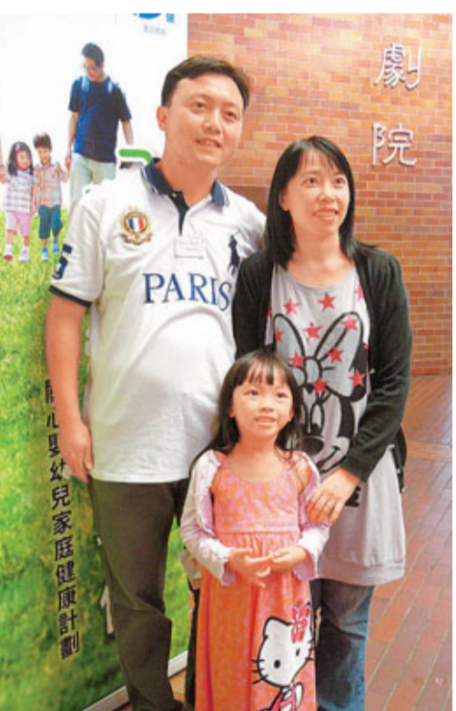
■莫先生指女兒初出生時,會因女兒的管教方法與太太爭吵。

育有1名女兒的莫先生指出,女兒初出生時,會因女兒的管教方法與太太爭吵,而且照顧女兒亦令他感到疲累,夫婦聊天的時間也減少,即使聊天大多關於女兒,後來抽空作為「二人世界」,關係才得以改善。