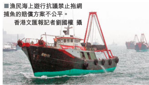
■漁民海上遊行抗議禁止拖網捕魚的賠償方案不公平。