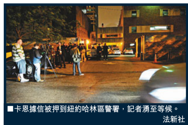
■卡恩據信被押到紐約哈林區警署，記者湧至等候。