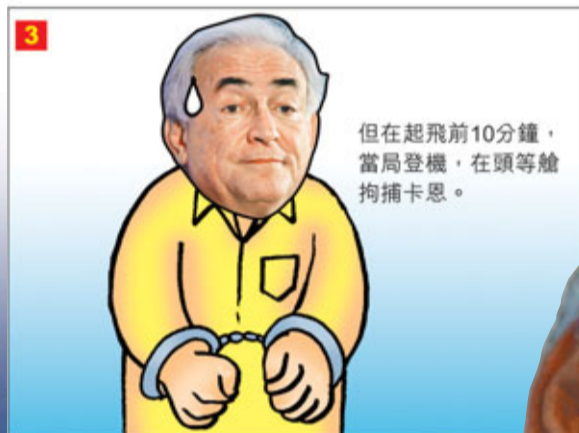
但在起飛前10分鐘，當局登機，在頭等艙拘捕卡恩。