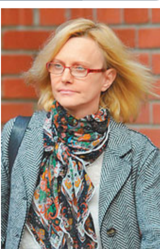
■被「偷食」的IMF匈牙利籍女下屬。網上圖片