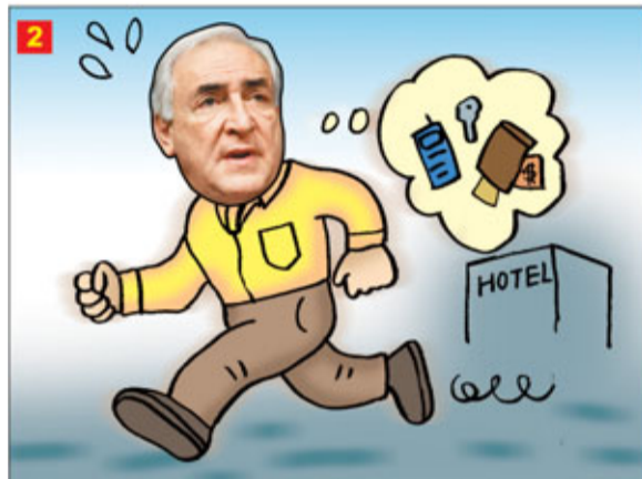
女服務員掙脫，離開後報警。卡恩事敗後匆匆逃離酒店，遺下手機和個人物品，乘飛機欲往巴黎。