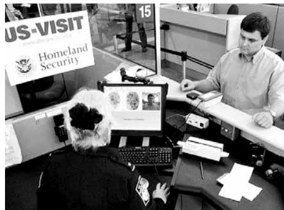
每年有大批外國人申請移民美國。

美國每年都會舉行一次全球性的移民簽證綠卡抽籤，讓一些移民美國機會較低的國家居民參加。然而美國國務院前日表示，由於電腦系統出錯，最新一次的抽籤結果需要作廢，2.2萬名獲告知移民夢有機會成真的「幸運兒」空歡喜一場。當局表示，將於7月15日公布重新抽籤結果。