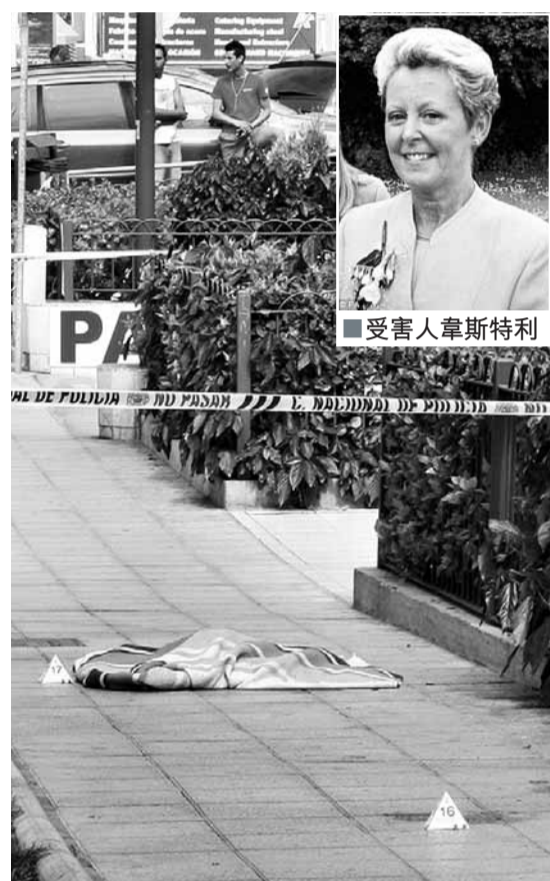
警方用布覆蓋受害人頭顱，並封鎖現場調查。