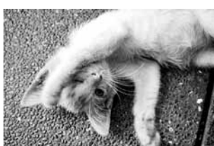
遭毒手的小貓。

香港近日發生連環虐貓案，菲律賓也有類似事件。當地一名大學生在校園內虐殺流浪貓後，竟肆無忌憚在網誌炫耀，最終成為該國首名因虐待單一動物被定罪的犯人。