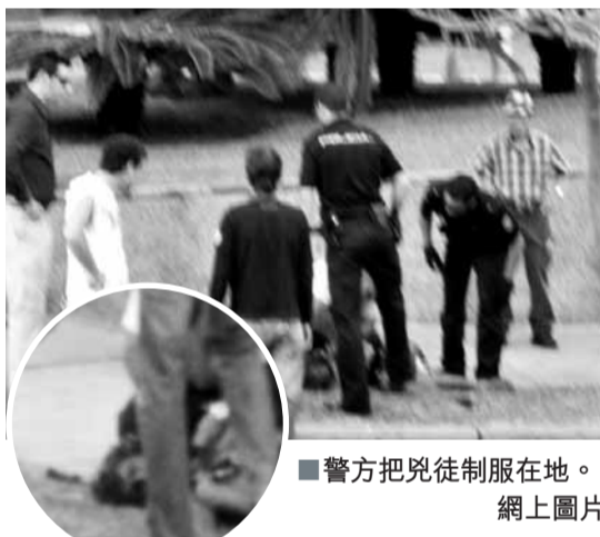
警方把兇徒制服在地。