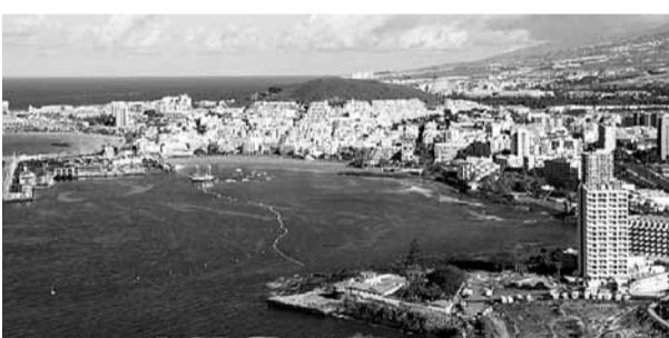
洛斯克里斯蒂亞諾斯風光如畫，每年吸引數百萬英國遊客。