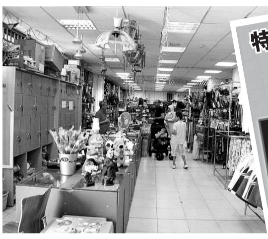
超市昨日如常營業。 網上圖片