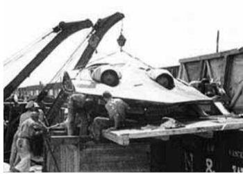
墜落的UFO可能是納粹德國的Ho 229定翼機。