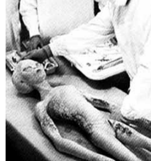
羅茲威爾外星人被指是異形兒童。