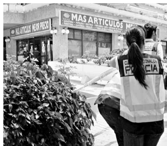
發生命案的華人超市。

西班牙度假勝地特內里費島發生駭人聽聞的兇殺案，一名精神失常、自稱「上帝先知」的男子，前日在當地一個華人超級市場，突然用刀襲擊一名老婦，並砍下她的頭顱。兇徒手持頭顱步出超市，並大呼「上帝降臨人間」，最後被途人制服。有報道指遇害婦人和兇徒素不相識，相信兇徒是隨機落手，但另有報道稱，兇徒此前數天曾跟蹤受害人。