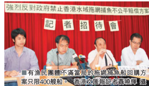
■有漁民團體不滿當局的拖網捕魚船回購方案只限400艘船。

香港文匯報訊(記者 聶曉輝) 為使漁業資源得以盡快復原,當局計劃明年底立法禁止在香港水域拖網捕魚,建議向全港1,100艘拖網漁船東發放特惠津貼,並向部分漁民回購漁船。有漁民團體指出,當局向業界透露回購方案只限400艘船,佔業界不足一半;且有漁船可獲最多550萬元特惠津貼,其他漁船則只獲15萬元一筆過補償,批評做法極不公平,要求當局提出新賠償方案。團體將於明日發動500艘漁船海上遊行抗議。