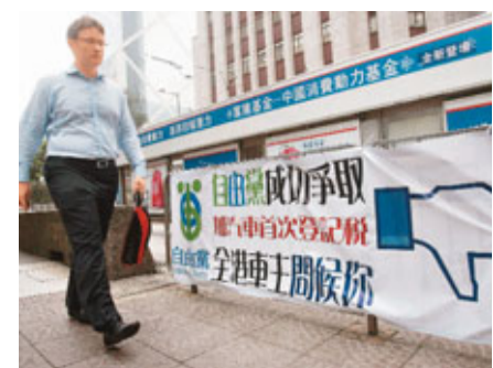
■有人冒自由黨之名在街頭掛橫額。香港文匯報記者劉國權攝

陳鑑林被問及在是次事件中是否有被抹黑時,未有正面回應,並相信事件不會影響其個人或政黨的聲譽。香港文匯報記者 鄭治祖