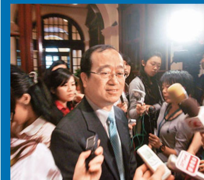
■黃容根建議政府研究方法,解決村民因鄉村基本配套不足遇到的生活問題。