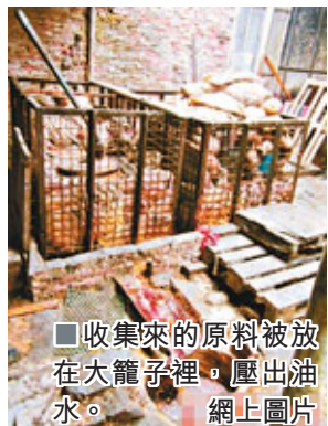
■收集來的原料被放在大籠子裡, 壓出油。

廣東省食安辦呼籲公眾積極投訴舉報食品安全違法生產經營行為, 共同監督和維護食品質量安全。對舉報經查實的, 將按有關規定予以獎勵。