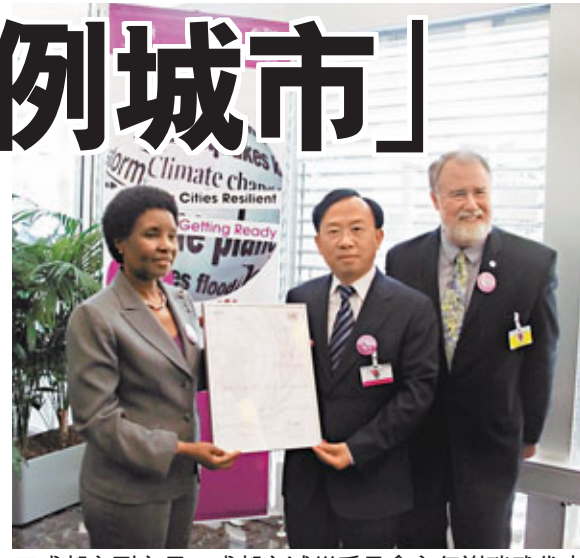
■成都市副市長、成都市減災委員會主任謝瑞武代表成都市領獎狀。

三年來, 成都市不僅克服了特大地震災害和國際金融危機雙重不利因素影響, 而且實現了經濟社會又好又快發展, 在全國15個計劃單列和副省級城市中的發展地位得到提升: 2010年全州市區生產總值5,551.3億元(人民幣, 下同), 同比增長15%, 總量居第5位, 比上年提高1位; 地方財政一般預算收入526.9億元, 增長36%, 總量居第5位, 比上年提高2位; 實際利用外資和進出口總額繼續保持中西部城市第一位, 並成功引進德國大眾、德州儀器、戴爾、聯想、富士康、仁寶、緯創等一批世界知名企業, 落戶成都的世界500強企業增至189家。2010年, 在美國知名財經雜誌《福布斯》刊發的世界未來十年發展最快的城市中, 成都位列首位。