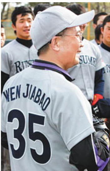
■溫家寶總理因當年身穿35號球衣打棒球，在日本得到了一個「35號球員」的雅號。資料圖片

中新社東京13日電 「35號」棒球手回信了。5月13日，中國駐日本大使程永華將中國總理溫家寶的回信親手轉交到了上智大學理事長高祖敏手中。高祖敏明在所有棒球部學生面前閱讀了這封信，再次獲得了學生熱烈的掌聲。