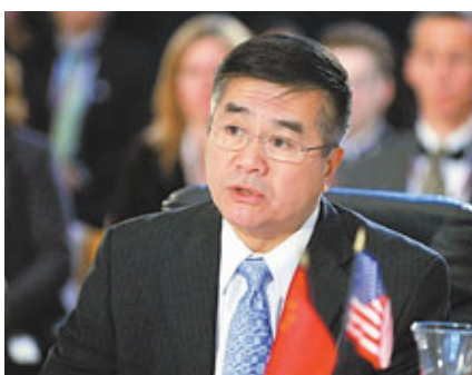
■候任美國駐中國大使駱家輝。

出生移民家庭的駱家輝，後來當上華盛頓州州長，也是史上首位華裔州長，他住進的州長官邸，「距我祖父洗碗打掃地板的地方，僅一英里之遙，但我們家