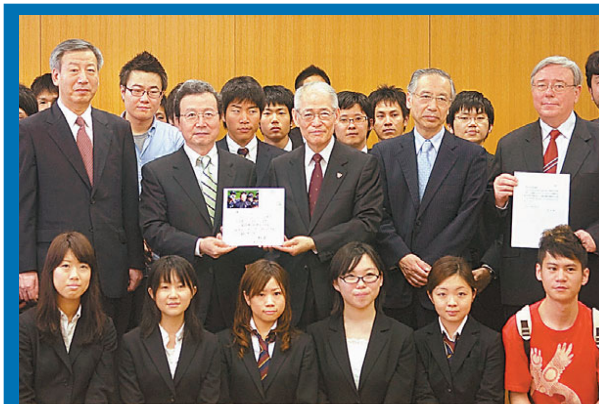
■中國駐日本大使程永華13日向日本上智大學轉交溫家寶總理的親筆信。