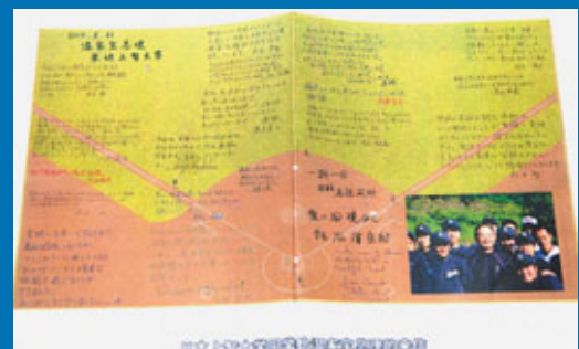
■日本上智大學學生集體寫給溫家寶總理的信件。