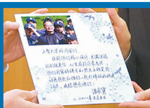
■溫家寶總理的親筆信。