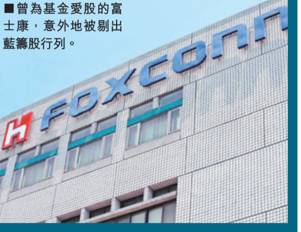
曾為基金愛股的富士康，意外地被剔出藍籌股行列。

較深度調整，估計23,000點將會失守，阻力位在於23,300至23,500點。