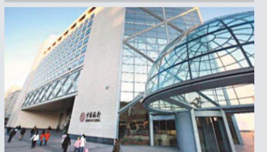
中行發債規模若達320億元，資本充足率將升至13.13%。

香港文匯報訊(記者 馬子豪) 中國銀行(3988)公布，將於下周二(17日)在內地銀行間債市發行不逾320億元(人民幣，下同)之定息次級債，以補充附屬資本；債券期限為15年，於第10年末附發行人贖回權。根據發債說明書顯示，倘是次實際發債240億元，中行資本充足率將達到12.99%，若發債規模達320億元，資本充足率將升至13.13%。截至今年首季，中行資本充足率為12.38%。 今年已有多家內銀進行或計劃以發債融資，如農行(1288)計劃年中發行300億元次級債，民行(1988)亦於此前發行次級債。