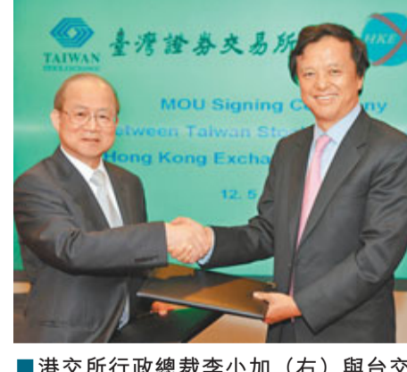
港交所行政總裁李加(右)與台交所董事長薛琦簽訂有關監管資訊互換諒解備忘錄。

香港文匯報訊 港交所(0388)昨在港與台灣證券交易所簽訂有關監管資訊互換的諒解備忘錄。諒解備忘錄由港交所行政總裁李加與台交所董事長薛琦簽訂。