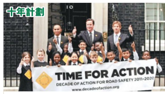
一隊對拿拿F1車手威頓(後排左)、畢頓(後排右)周三與英國首相卡梅倫在唐寧街10號門外，與一眾童童宣傳道路交通安全的10年行動。

據新華社11日電 希臘官員11日透露，經過數年考慮，希臘最終決定對F1「放行」，將在西部港市佩特雷附近修建F1賽道。將承辦此項目的經理、原佩特雷市長弗洛拉托斯11日表示，此項目已經被列入政府發展計劃。他說：「達成這一步用了很多年的時間。」