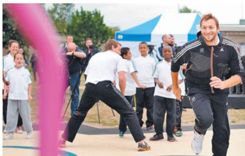
科比坦承目前狀態與以往差距甚遠。

科比曾在04年雅典奧運的男子200米自由泳擊敗菲比斯，故外界經常希望可再上演這場「世紀賽事」，不過科比表示只對能再次比賽感到高