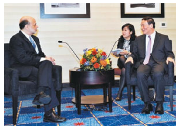
華盛頓時間11日, 中國國務院副總理王岐山會見美聯儲主席伯南克。