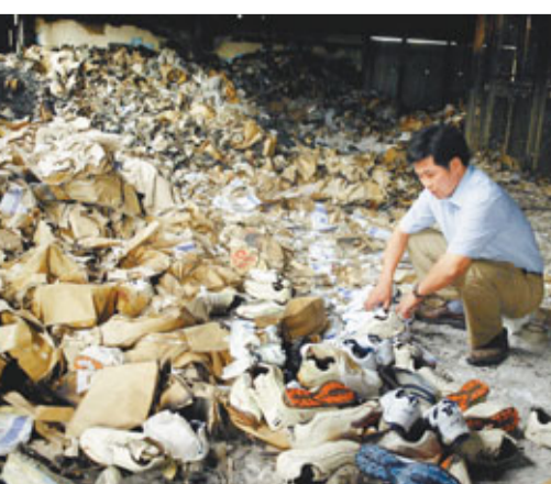
2004年的「燒鞋事件」令不少華商損失慘重。

7年前, 由於華人的鞋業貿易對西班牙埃爾切市的製鞋業產生了一定影響, 從而引發了一部分當地商家對華商心懷恨意, 在一些暴徒的惡意煽動下, 爆發了燒鞋事件。2004年9月16日大批當地商家帶人走上街頭遊行示威, 並引起暴亂。在暴亂中, 一些人不但設置路障, 毀壞公共財物, 而且還想強行闖入華人在當地的公司。在沒有得逞後, 騷亂的人群攔住了一輛華商運鞋的貨車, 並將車上的鞋子全部倒出來, 放火焚毀。