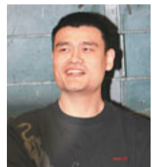
上海最年輕的百強富豪姚明。

白皮書顯示, 目前大約有350位十億富豪駐上海, 其中約有240人為隱形富豪, 另外「陽光富豪」有109人, 人數居全國第二; 北京則以124人居全國第一。此外, 全國十億富豪大約有4,000人, 其中1,363人為陽光富豪。對比全國其他城市, 上海陽光富豪人數居全國第二, 北京則以124人居全國第一。