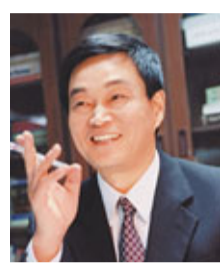
上海地區首富劉永行。

香港文匯報訊(記者 周逸 上海報導) 胡潤研究院昨日發佈《高傳2011胡潤上海財富白皮書》(以下簡稱「白皮書」), 白皮書顯示, 目前大約有350位十億富豪駐上海, 其中約有240人為隱形富豪, 另外「陽光富豪」有109人, 人數居全國第二; 北京則以124人居全國第一。