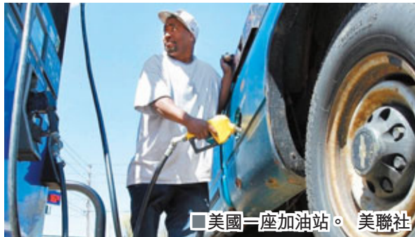
美國一座加油站。

加倫3.1228美元，跌幅7.6%，創2009年2月以來最大單日跌幅。6月輕質低硫原油期貨結算價跌5.67美元，至每桶98.21美元，跌幅5.5%。布蘭特期油結算價跌5.06美元，至每桶112.57美元，跌幅4.3%。6月取暖油期貨結算價跌10.29美仙，至每加倫2.8983美元，跌幅3.4%。美國能源情報署前日公布，上周汽油庫存意外上升130萬桶，為2月份以來庫存首次增加，顯示需求疲軟。上周原油庫存上升380萬桶，升幅高於預期。 ■《華爾街日報》