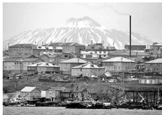
南千島群島中的島嶼。資料圖片

俄羅斯「無畏級」驅逐艦「維諾格拉多夫海軍上將」號、挪威「南森級」護衛艦「海爾格·英斯塔」號、海上警衛隊、海軍戰機等都會參演。雙方還將出動海岸護衛隊艦艇和海軍軍艦等。 ■路透社/中通社