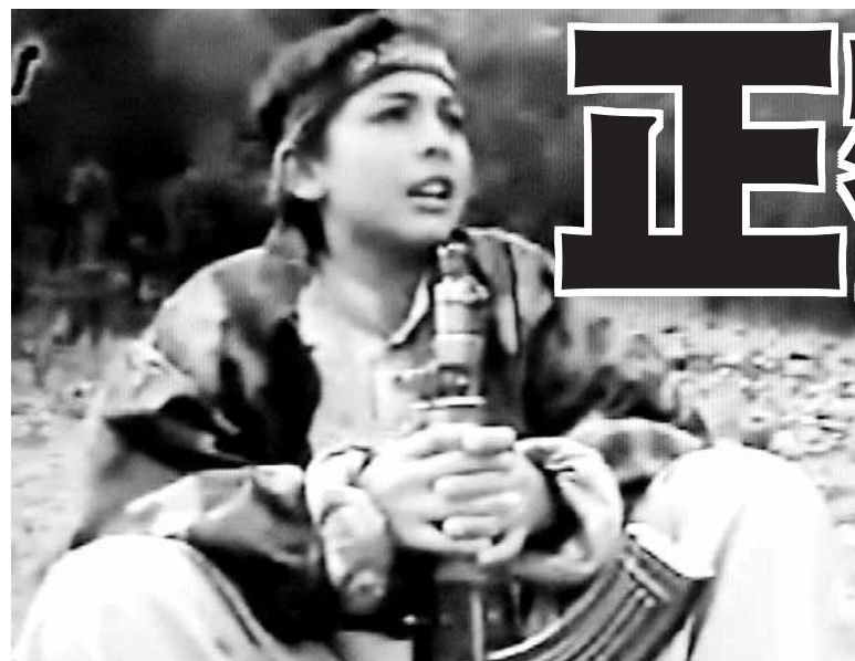
哈姆扎被拉登視為「基地」未來領袖，涉及暗殺巴基斯坦前總統貝納齊爾。網上圖片

「基地」組織頭目拉登被殺後，其4名兒子前日首次打破沉默，譴責美國暗殺行動嚴重違反國際法，「任意殺害」他們手無寸鐵的父親，棄屍大海更是對家族的侮辱，據報他們準備聘用英國律師，將美國告上法庭。另外，據報美軍突擊行動當天，號稱「恐怖王儲」的拉登幼子逃脫，可能正策劃報復。