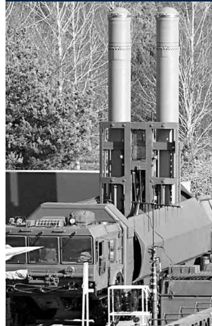
俄國早前向越南出售的「堡壘」系統。

俄羅斯一名高級將領透露，俄國將於今年內向與日本有爭議的南千島群島(日稱北方四島)，運送導彈及其他火炮等軍備，並會於今年下旬開始在島上興建2個哨站，預計明年完成。消息料將引起日方強烈抗議。