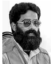
卡什米里其貌不揚，曾是巴基斯坦前特種部隊突擊隊員，曾與多宗「孟買式」恐襲有關，美國中情局多年來一直追捕卡什米里，有美國官員稱他是「基地」領袖接班人的黑馬。

美國總統奧巴馬最快將於下周向穆斯林世界講話，講述拉登之死，並強調「基地」組織在穆斯林世界再無影響力。然而「基地」阿拉伯半島分支領袖瓦赫希警告，「基地」會發動新一輪聖戰向美國人報復。「基地」第二號人物扎瓦希里原本是繼任拉登大熱人選，但他在部分地方不得民心，所以「繼位」存在變數。而「基地」巴基斯坦新卡什米里(見圖)或能壓過另外5名「候選人」，成為接班人黑馬。卡什米里其貌不揚，曾是巴基斯坦前特種部隊突擊隊員，曾與多宗「孟買式」恐襲有關，美國中情局多年來一直追捕卡什米里，有美國官員稱他是「基地」領袖接班人的黑馬。