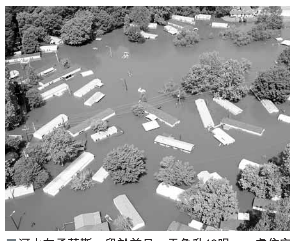
河水在孟菲斯一段於前日一天急升48呎，一處住宅區全部被淹。美聯社

河邊「水上賭場」亦受波及，會展業人士透露，當地賭業已被經濟不景氣重挫，復甦勢頭面臨時卻被洪水侵襲，只能大嘆倒楣。 ■法新社/美聯社/路透社/《華爾街日報》