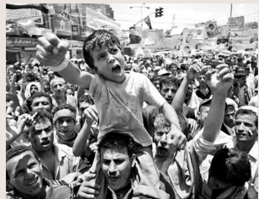
參與示威的小童也非常肉緊。

也門軍警昨日向南部城市塔伊茲的反政府示威者開火，造成至少3人死亡，多人受傷。示威者則佔領塔伊茲內3幢政府建築物，包括石油部大樓，並衝擊警察總部，將一名被指開槍的警員帶到檢察官辦公室。