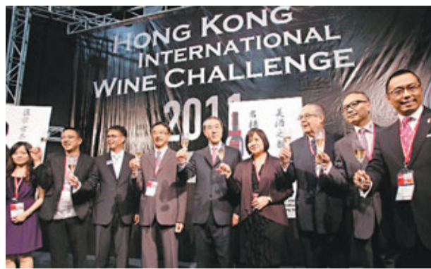
眾嘉賓出席國際餐飲業展覽。