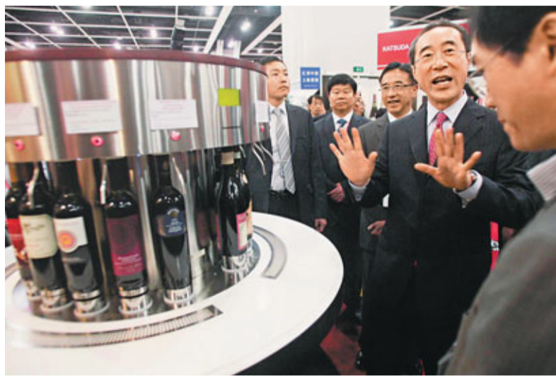
唐英年參觀會場的紅酒及相關產品展銷。

香港文匯報訊(記者 羅敬文) 國際餐飲業展覽昨日起一連4日在灣仔會議展覽中心舉行,吸引逾1,800間公司參展,但受日本核輻射影響,日本參展商減至18間,較上屆減少70%。參展的本港展商肩負了挽回食客信心的重責,有展商以新產品突圍,推廣聲言有治癌及防癌功用的水雲等海產。