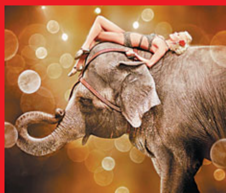
片中大象女角演出美妙。