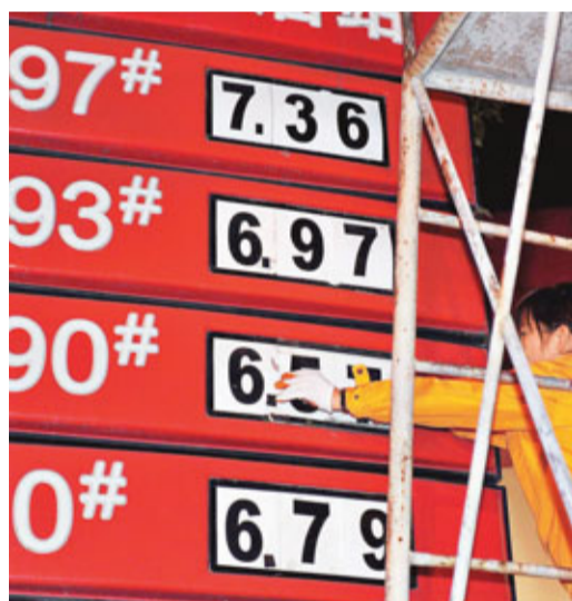
■大成基金認為，國際油價下跌紓緩成品油價格上調壓力，進而紓緩中國通脹。資料圖片

不過，大成基金認為，歐美央行不停止放水，其他國家為抑制通脹所做的努力可能很難見效。近期美國就業數據的惡化或令美聯儲遲遲不能下決心退出量寬政策，加上歐洲央行也因債務危機對退出量寬政策心存憂慮，故要回收之前量寬政策所釋放的龐大流動性將是漫長過程。