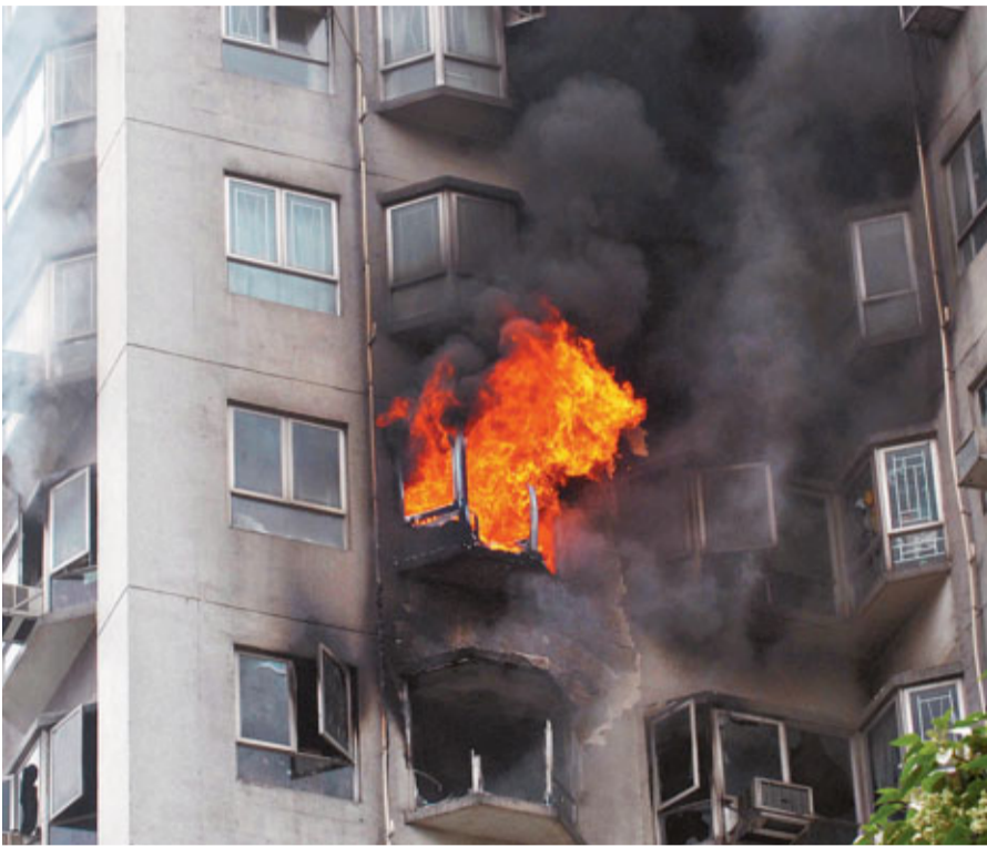
■家居保險保障範圍主要包括單位因火災、水管爆裂、失竊等引致的金錢損失。資料圖片

除財物保障，家居保險多會附有個人責任保險，可保障投保人或同住家人因疏忽，導致第三者意外受傷或財物損失