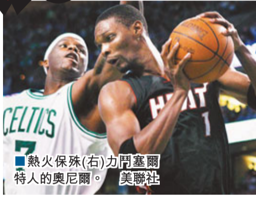
■熱火保殊(右)力阻塞爾特人的奧尼爾。

9日的兩場NBA季後賽均戰至加時賽，新「三巨頭」發威的邁阿密熱火在客場通過一個加時賽以98:90戰勝波士頓塞爾特人，以總比分3:1獲得賽點；而俄克拉荷馬雷霆則在客場經過三個加時賽以133:123擊敗孟菲斯灰熊，將總比分扳為2:2平。