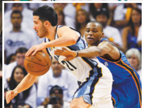
■雷霆隊韋斯布魯克(右)從後拍走灰熊隊華斯奎斯手中球。

在上一回合負於塞爾特人的比賽中，熱火隊「三巨頭」占士、韋迪和保殊總共才得到44分。是役，「三巨頭」重新找回了感覺，聯手砍下熱火全隊98分中的83分和45個籃板中的35個。塞爾特人隊的老「三巨頭」加納特、皮亞斯、雷·阿倫只聯手得到51分，比上場少了19分。