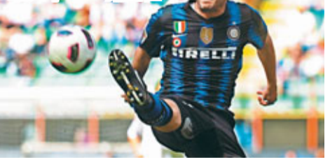
柏仙尼為國米爭取入球。

的人」，李帥是役當然想一眾國米球員做齣好戲，而其麾下戰將，中場史奈達未傷癒，然而另一中場鐵漢史坦高域據報可提前復出，上陣製造殺機。