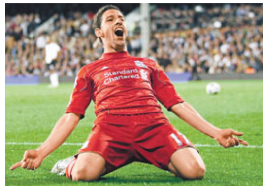
麥斯洛迪古斯入三球。

曼聯將第19次在本土頂級聯賽封王，甩開紅軍獨享紀錄，紅軍隊長謝拉特揚言會捲土重來，來季挑戰曼聯的佳績：「這令我們很受傷，因為我們保持了那紀錄很久了，但卻會給我們動力。他們超越了我們，但我們正重回正軌。」