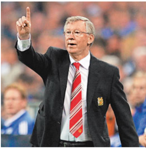
費格遜指歐聯冠軍。

費爵爺又認為現時的曼聯將有光明的未來：「現在隊中擁有很多正值青春年華的出色球員，比如22歲的查維亞靴南迪斯、23歲的伊雲斯和吉遜，還有21歲的基斯史摩寧，這為球隊未來奠定堅實的基礎。」費Sir坦言，不少小將都是「買回來的」，但球隊仍一直重視青訓工作，當中亦不乏後起之秀。