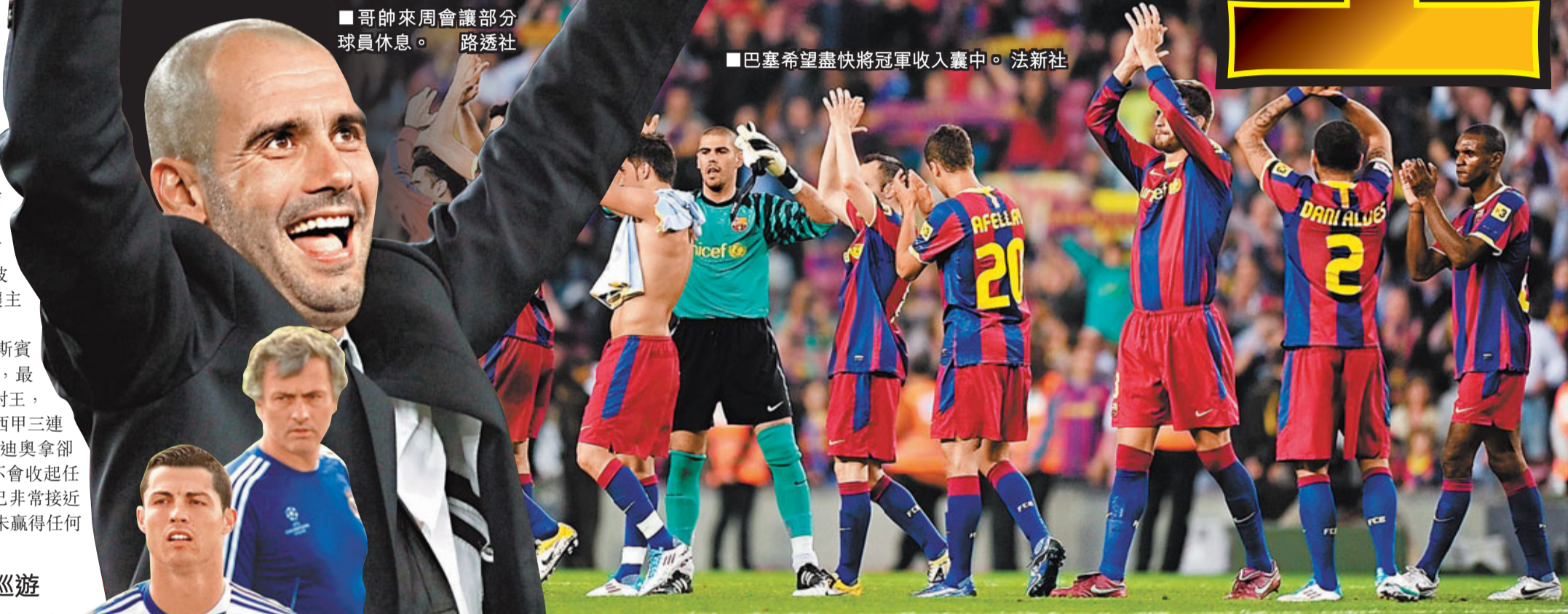
哥帥來周會議部分球員休息。