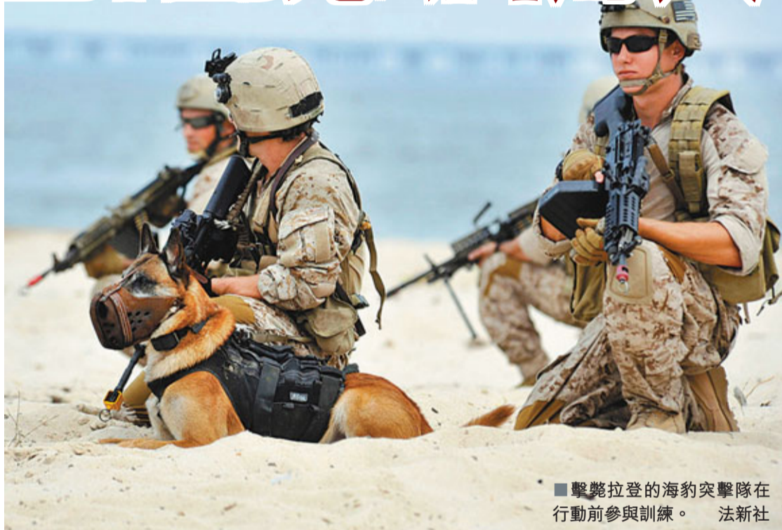
■擊斃拉登的海豹突擊隊在行動前參與訓練。