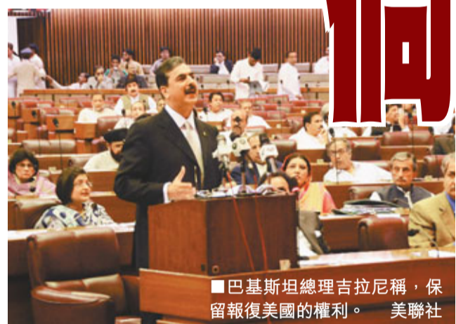
■巴基斯坦總理吉拉尼稱，保留報復美國的權利。

美軍方面採取突擊行動，擊斃藏匿巴基斯坦的「基地」領袖拉登，引發美巴兩國一場外交風波。華府繼續披露更多獵殺拉登行動的細節，《紐約時報》引述美國高級官員爆料，奧巴馬堅持參與行動的特種部隊兵力，必須能在遭遇巴國軍警阻攔時仍能「殺出重圍」，繼續執行任務，奧巴馬不惜準備與盟國爆發武裝衝突，顯示美巴關係的脆弱。