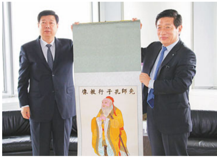
山東省委書記姜異康（左）在港會見中國銀行（香港）總裁和廣北。

資料顯示，中銀香港旗下南洋商業銀行在青島設立分行已有17年歷史，先後與中國重汽、山水水泥、萊蕪鋼鐵等逾百家企業建立貸款業務，累計貸款額超過百億元人民幣。此外，與山東省國有資產控股有限公司合資成立山東東銀投資管理有限公司，以戰略投資者的身份向山東重汽（香港）有限公司投資2.33億港元，向東嶽集團有限公司投資2.36億港元。