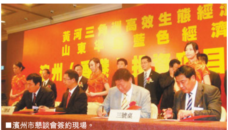
濱州市懇談會簽約現場。

鄧向陽表示，目前，濱州已與60多個國家和地區建立了經貿合作關係，擁有外商投資企業近600家，多家世界知名企業落戶濱州。其中香港上市公司達到5家，在香港聯交所初步構築起了資本市場的「濱