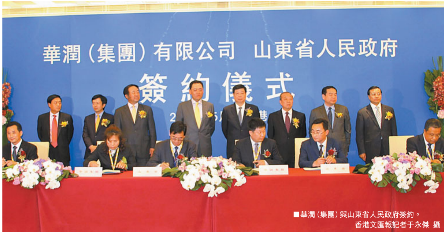
華潤（集團）與山東省人民政府簽約。

結構的關鍵時期，「十二五」期間將調整產業結構，大力發展戰略性新興產業。而剛剛升級為國家戰略的黃三角高效生態經濟區和山東半島藍色經濟區，將成為山東經濟發展的強大引擎，也為港企投資山東帶來空間和機遇。山東團今次來港將主要推介上述兩大戰略，同時擬在金融、商貿、旅遊等方面與港深入合作。