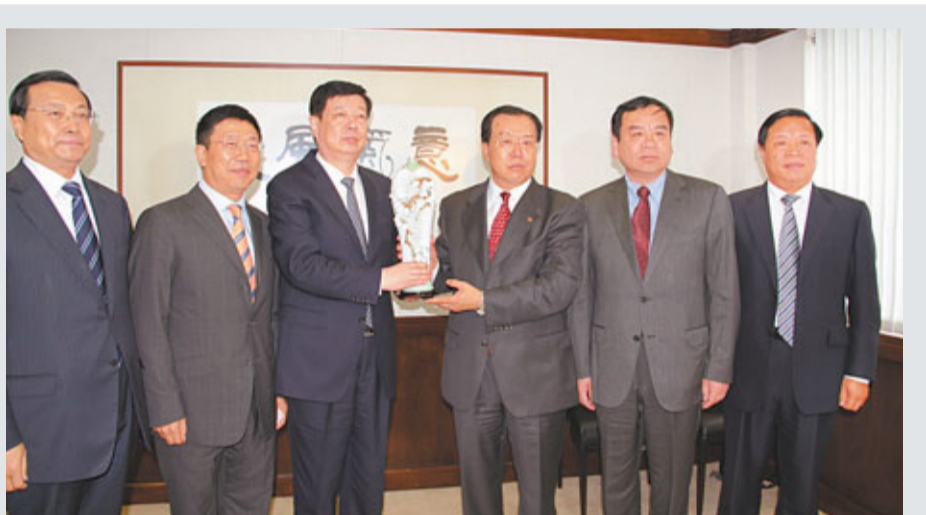
山東省委書記姜異康走訪香港中旅集團，會見張學武董事長。

結構的關鍵時期，「十二五」期間將調整產業結構，大力發展戰略性新興產業。而剛剛升級為國家戰略的黃三角高效生態經濟區和山東半島藍色經濟區，將成為山東經濟發展的強大引擎，也為港企投資山東帶來空間和機遇。山東團今次來港將主要推介上述兩大戰略，同時擬在金融、商貿、旅遊等方面與港深入合作。