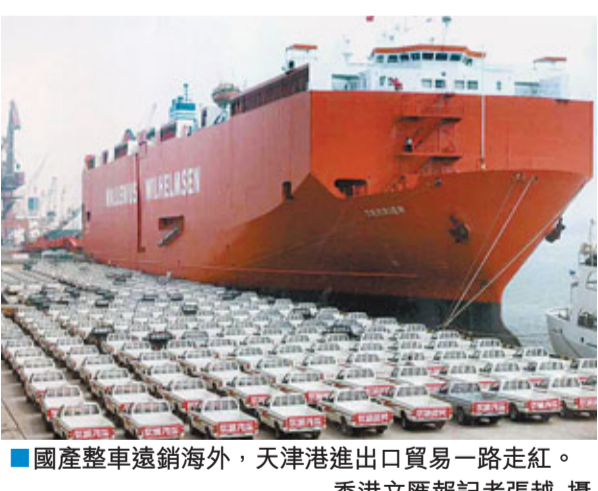
■國產整車遠銷海外，天津港進出口貿易一路走紅。

香港文匯報訊 據《濱海時報》報道，記者日前從天津市口岸辦獲悉，一季度，天津口岸進出口貿易額累計完成432.54億美元，同比增長19.9%。天津港貨物吞吐量累計完成1.03億噸，同比增長10.7%。空港旅客吞吐量累計完成177.53萬人次，同比增長9.9%；貨郵吞吐量累計完成4.30萬噸，同比減少14.2%。船舶到離港10924艘次，同比增長7.6%；飛機運輸17887架次，同比增長6.1%。