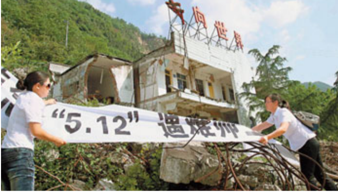
■10日，北川曲山小學的兩位老師在原校址掛悼念橫額。

香港文匯報訊(記者 李理 北京報道) 在「5·12」汶川特大地震3周年紀念日來臨之際，記者從中國銀監會了解到，截至2011年3月末，內地各銀行機構累計向災區發放貸款5,216.4億元(人民幣，下同)。在災區銀行業金融機構重建方面，銀監會稱，目前已經完成毀損網點重建任務的88.6%。