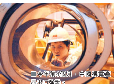
今年前4個月，中國機電產品出口強勁。

香港文匯報訊 (記者 劉曉靜 北京報導) 中國4月份進出口貿易順差超預期，但前四個月總體順差繼續收窄。對此，專家指出，4月份順差超預期，主要是受進口增速明顯回落的影響。總體來看，在中央「穩出口、擴進口、減順差」政策之下，全年貿易順差仍將繼續收窄，預計全年貿易順差將低於1,200億美元。