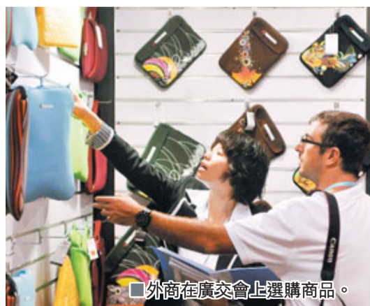
外商在廣交會上選購商品。