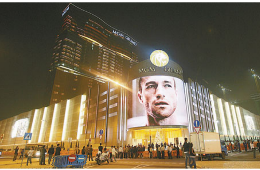
美高梅中國將於5月23日起公開招股，6月3日掛牌。資料圖片

而澳洲鐵礦開採商OM Holdings Ltd.昨日表示，該公司在香港和澳洲兩地上市的計劃不受阻礙。在上個月的年度股東大會上，該公司有關修訂公司章程的議案未能通過，另一項有關雙重上市的議案則獲通過，而此前大股東Consolidated Minerals Pty曾以損害股東利益為由極力反對該公司赴香港上市。 多次延遲上市的澳洲源庫資源(Resourcehouse)或於下周二路演，集資156億至234億元，保薦人包括中銀國際、匯豐、RBS、瑞銀。中銀報告預料該公司要到2015年度才能盈利，盈利額並由今年初估計的14.25億澳元降至現時預測的3.39億澳元。