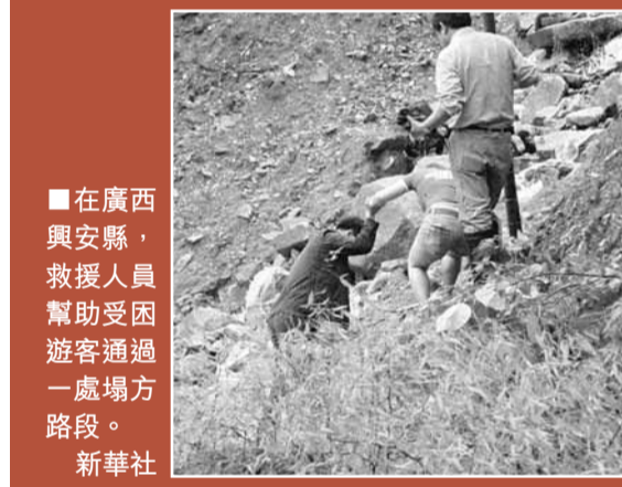
在廣西興安縣,救援人員幫助受困遊客通過一處塌方路段。