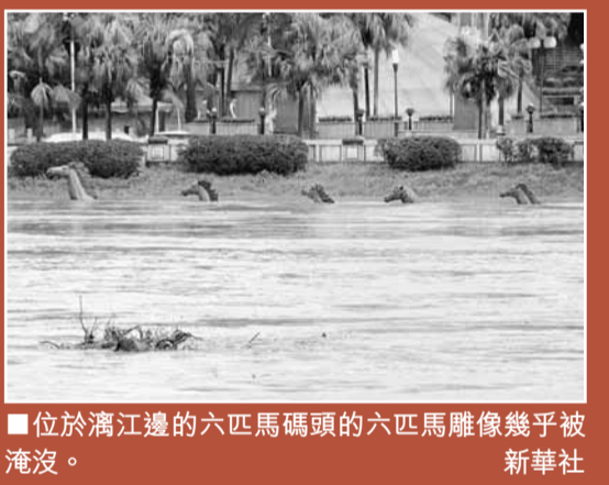
位於瀋江邊的六匹馬碼頭的六匹馬雕像幾乎被淹沒。