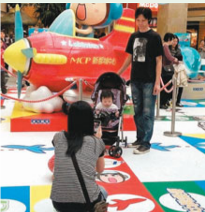
■香港文匯報記者吳欣欣攝 ■根據統計數據，2009年，本港女性首次生育的平均年齡為29.8歲。

「中女」(Spinster) 是中年單身女性的簡稱，有廣義和狹義之分：在廣義上，意指接近或年過30歲的女性；在狹義上，專指踏入中年，還沒有結婚或選擇不結婚的女性。有學者指，這一性別群體常見於現今的已發展國家（如美國和英國等），及發展中國家裡城市化程度較高的城市（如中國的北京、上海和印度的新德里等），大部分接受良好教育、有穩定工作及經濟獨立。由於她們單身(Single)，多出生於上世紀70年代 (Seventies)，同時在愛情上被卡住 (Stuck)，故有「3S女人」之稱。有學者認為「中女」是21世紀的社會現象。 ■香港文匯報記者 吳欣欣