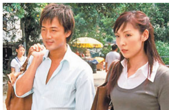
■本港06年首播的電視劇《女人唔易做》以兩名超過30歲女主角的婚姻故事為主線，當中更涉及姊弟戀及未婚借種生仔等引起社會熱議的情節。 資料圖片

自上世纪80年代開始，香港經濟起飛，女性的學歷、地位及經濟能力日益提高，部分更「擔起成頭家」，其生活不用靠男性，結婚自然不再是唯一出路。外國有兩性研究學者分析男女嫁娶的傾向時提出，大部分女性揀選丈夫時，都希望對方的身高、年齡、地位、權力及金錢等都比自己優勝；相反，一般男性會選擇比自己條件差的女性為妻子。故隨