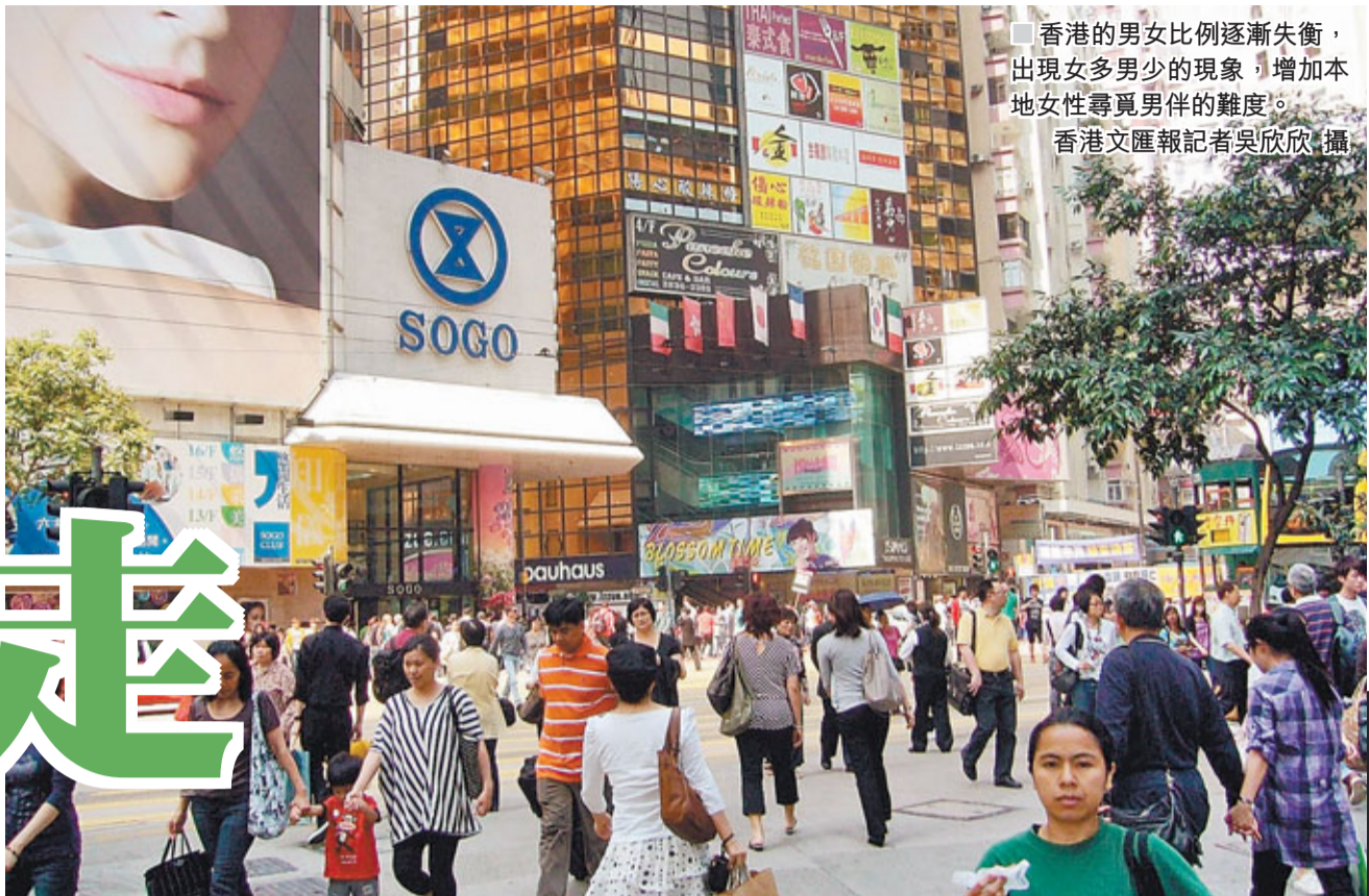
香港的男女比例逐漸失衡，出現女多男少的現象，增加本地女性尋覓男伴的難度。

事業如日中天、愛情未有着落，這是部分現代成熟女性的生活寫照；為凸顯其存在，香港社會稱之為「中女」。究竟她們是「無人要」還是「唔恨嫁」？兩岸三地的「中女」有何異同？這種現象對社會有何影響？下文將作詳細探討。 ■香港文匯報記者 吳欣欣