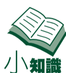
製表：香港文匯報記者 吳欣欣