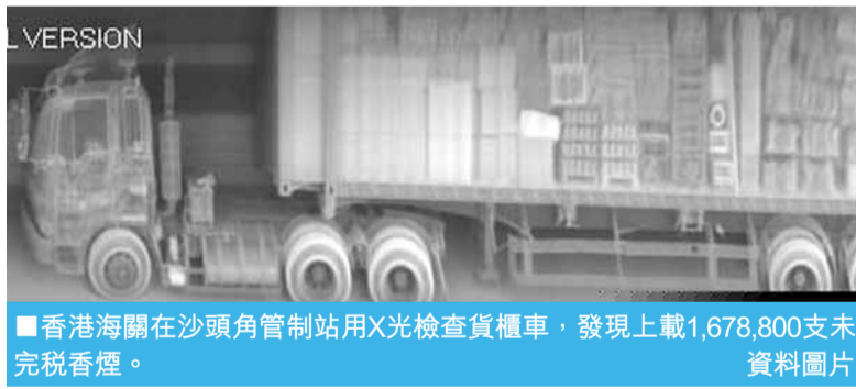
■香港海關在沙頭角管制站用X光檢查貨櫃車，發現上載1,678,800支未完稅香煙。資料圖片

海關方面亦加強稽查力度和深港合作。據了解，深圳海關積極引進高科技設備，整合部門優勢力量，構築了嚴密的監管體系，採取了包括加強情報收集經營、開展風險分析、強化正面監管、嚴密查緝等多項措施嚴厲打擊；通過深港合作，發動聯合行動。近年深圳還出台知識產權保護條例，通過引入刑事打擊保護知識產權，遏制製假售假。