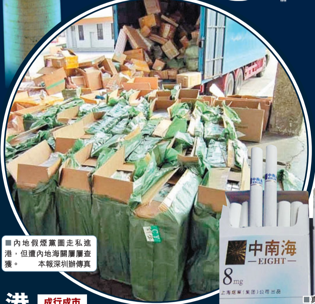
內地假煙黨圖走私進港，但遭內地海關屢查獲。本報深圳辦傳真

香煙走私在深港兩地本已猖獗，香港近年持續大幅提高煙稅，令兩地香煙差價進一步拉開，不法分子開始轉而走私利潤更加豐厚的假冒名煙。據了解，一包成本僅10元的假中華在市面上可售數十元，其利潤至少可達200%，而世界名牌香煙走私出境，獲益更達600%，稱得上「有販毒的利潤而無販毒的風險」。煙民購買走私煙大都貪其便宜，但有煙草專賣局專家指出，一支合格的香煙從煙草選擇到焦油控制，甚至連黏貼煙紙的膠水都大有學問，而市面出售的假煙，生產設備簡陋、衛生條件極差，製作過程中更不會嚴格控制這些危害因素，對吸食者帶來的健康隱患難以估計。■本報記者 鄭海龍 實習記者 王悅、熊麗芳、劉晶 通訊員袁之胤 深圳報道