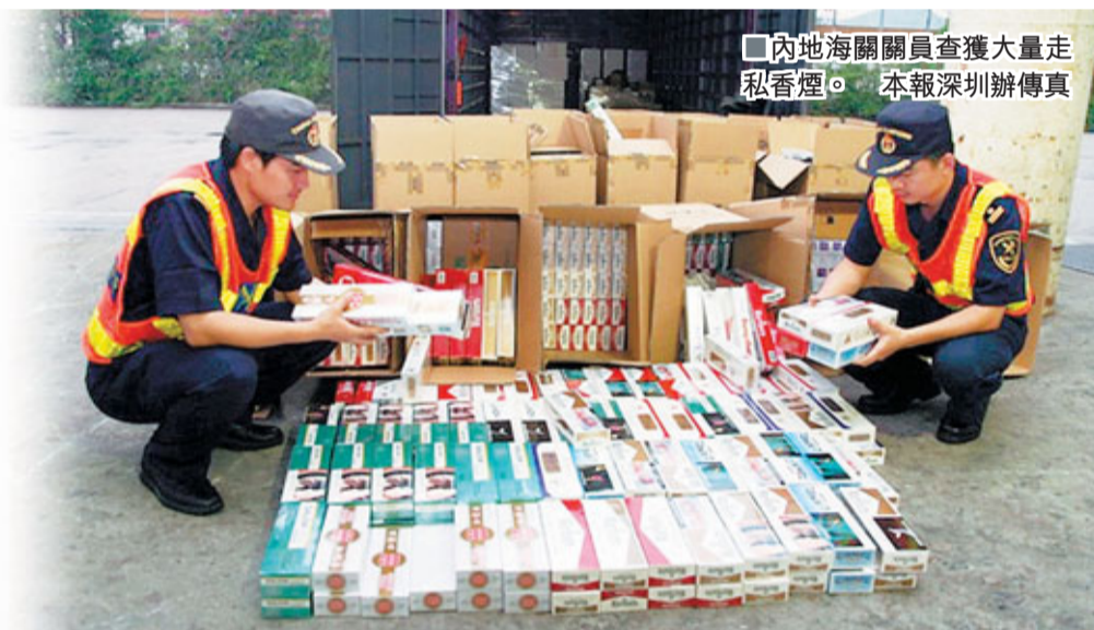
內地海關關員查獲大量走私香煙。本報深圳辦傳真

據深圳海關工作人員介紹，隨著香港與內地香煙價格進一步拉大，兩地不法分子覬覦其中的商機，開始聯手售假。海關緝獲的私煙量明顯上升，這些聯手售假集團，甚為專業，多採取分段經營的方式，即在其鏈條中，把製造、銷售、走私、運輸等不同環節，分給不同的集團經營，而各集團間既互不相涉及互不相打探，最大限度地保護集團的安全。