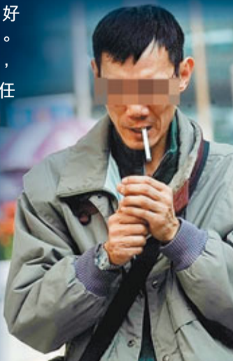
■本港多次加煙稅，部分煙民若「貪平」轉買私煙，隨時買錯假煙，吸食更損健康。資料圖片

據香港海關反私煙調查組指揮官許偉明介紹，不法分子選擇香港作走私煙的中轉點，除了因為船期的客觀原因外，還因為香港本身沒有生產假煙，他國海關會因香港的良好信譽而降低對貨物的警覺程度。香港卷煙售假規模呈擴大趨勢，其打擊非法走私、售假活動也任重而道遠。