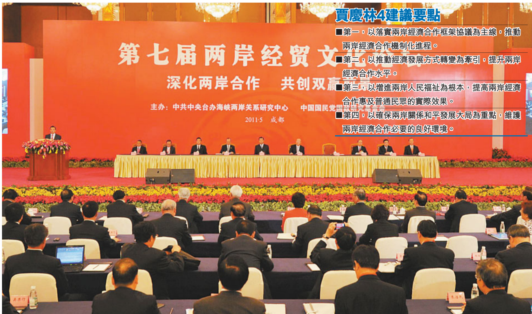
第七屆兩岸經貿文化論壇昨日在四川省成都開幕。

香港文匯報訊(記者 江雨馨 成都報導)第七屆兩岸經貿文化論壇7日上午在成都開幕。中共中央政治局常委、全國政協主席賈慶林出席開幕式，就深化兩岸經濟合作提出四點建議。賈慶林並強調，兩岸同胞都應自覺珍惜兩岸關係和平發展的機遇，鞏固兩岸關係和平發展的政治基礎，維護兩岸關係和平發展的大局。