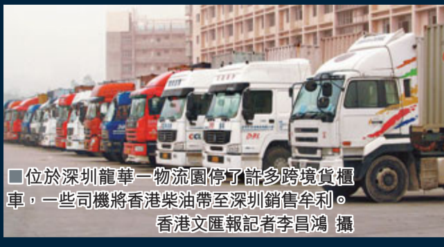
■ 位於深圳龍華一物流園停了許多跨境貨櫃車。一些司機將香港柴油帶至深圳銷售牟利。

為了整頓跨境貨櫃司機走私柴油的行為，目前，港粵運輸業聯合會已向運輸公司下發專項打擊的通知，要求他們通知司機，要遵紀守法，勿知法犯法，否則一旦被查獲，將被扣查半年，中止其貨運資格，將得不償失。