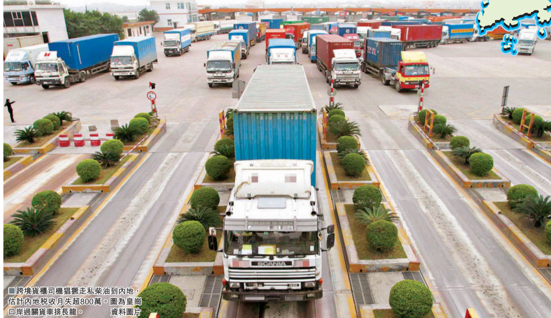
■ 跨境貨櫃司機猖獗走私柴油到內地，估計內地稅收月失超800萬。圖為皇崗口岸過關貨車排長龍。資料圖片