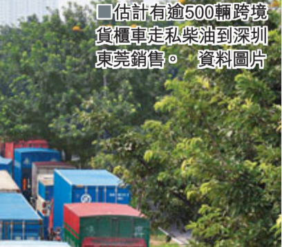
■ 估計有逾600輛跨境貨櫃車走私柴油到深圳東莞銷售。資料圖片

謝浪稱，據他了解，有不少個體跨境貨櫃車司機，因業務清淡，收入下降，為了應對內地物價上升和港幣貶值帶來的生活壓力，便更積極地走私香港柴油到深圳、東莞等地出售，他們通過加多一個400公升油箱，共攜帶800公升柴油，並向海關申報長途運輸需要，這樣一次可售900公升，可以獲利600多元，一個月走私15次即可獲得近萬元收入，比主業1.1萬元的月收入更高。但他們也時刻擔憂有一天被抓獲，因此在出售過程中尤為小心，一聽說打擊要來就收斂一些。