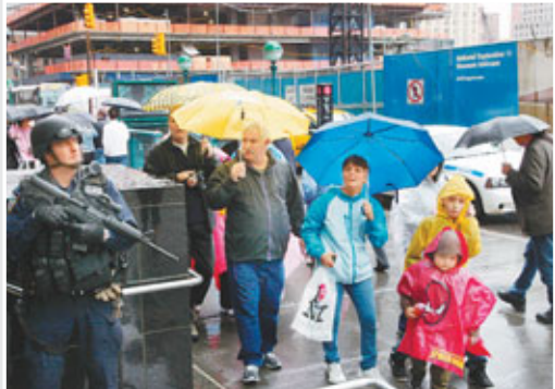
■紐約市警方在世貿遺址等重要地標加強保安。

美軍擊斃恐怖組織「基地」領袖拉登後，在其大屋內帶走大量情報資料。國土安全部前日表示，經分析後，發現「基地」去年2月策劃在今年9月的「911」恐襲10周年，在美國某個地點向鐵路系統施襲，藉著破壞路軌，令火車翻覆，掉落某個山谷或橋樑。