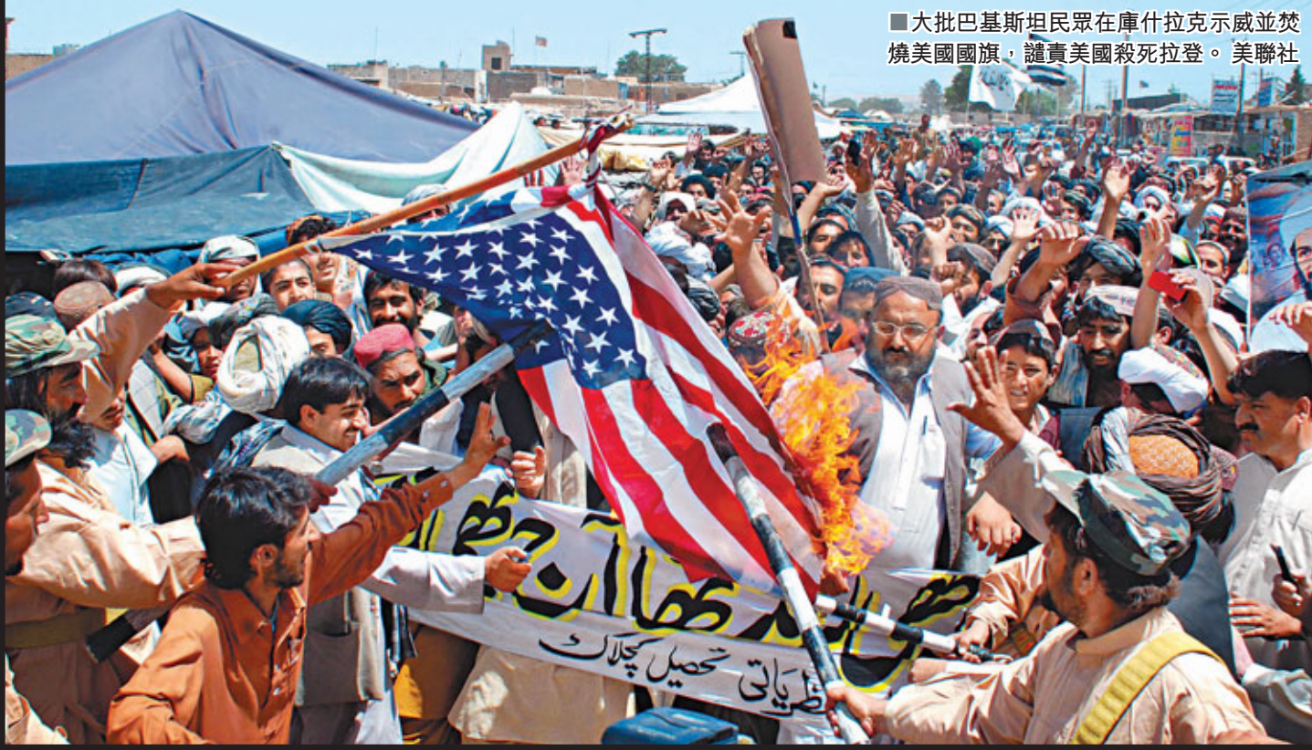
■大批巴基斯坦民眾在庫什拉克示威並焚燒美國國旗，譴責美國殺死拉登。

美軍單方面獵殺拉登，又暗示巴基斯坦包庇拉登，引起盟友巴國不滿，巴軍揚言考慮調整與美反恐合作政策，又警告美國和其他國家若再有類似行動，將導致「災難性」後果。美軍「海豹」突擊隊成功獵殺拉登後，奧巴馬即被揭發自2009年起，暗中擴充海豹等精銳部隊規模。他們去年執行數千次突擊行動，殺死約3,200名叛亂分子，並拘捕逾8,000人。