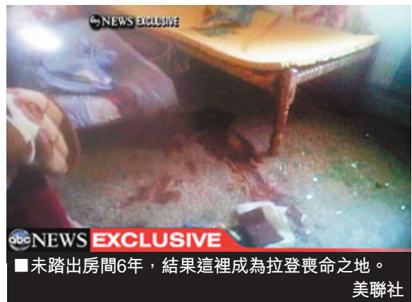
■未踏出房間6年，結果這裡成為拉登喪命之地。