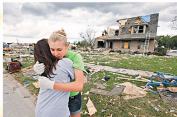
■龍捲風令美國居民痛失家園。

日本地震海嘯後，傳媒每天鋪天蓋地報道。但地球另一邊廂，龍捲風卻默默「起圍」。按美國國家氣象局(NWS)初步報告，自上月22日暴風雨肆虐以來，已出現至少接近300個龍捲風報告。