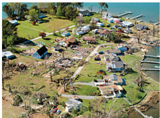
■美國受到龍捲風連日襲擊。