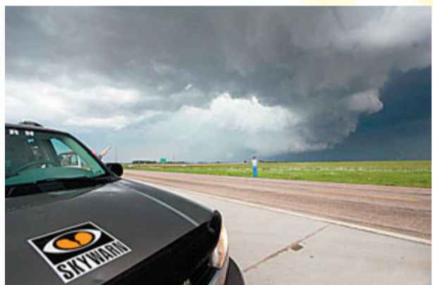
■美國希望培訓更多「追風」高手。