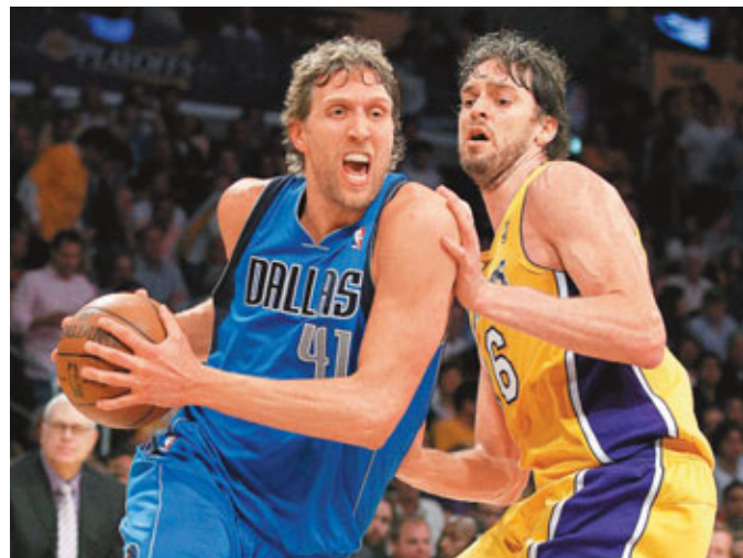
魯域斯基(左)與加素表現大相逕庭。