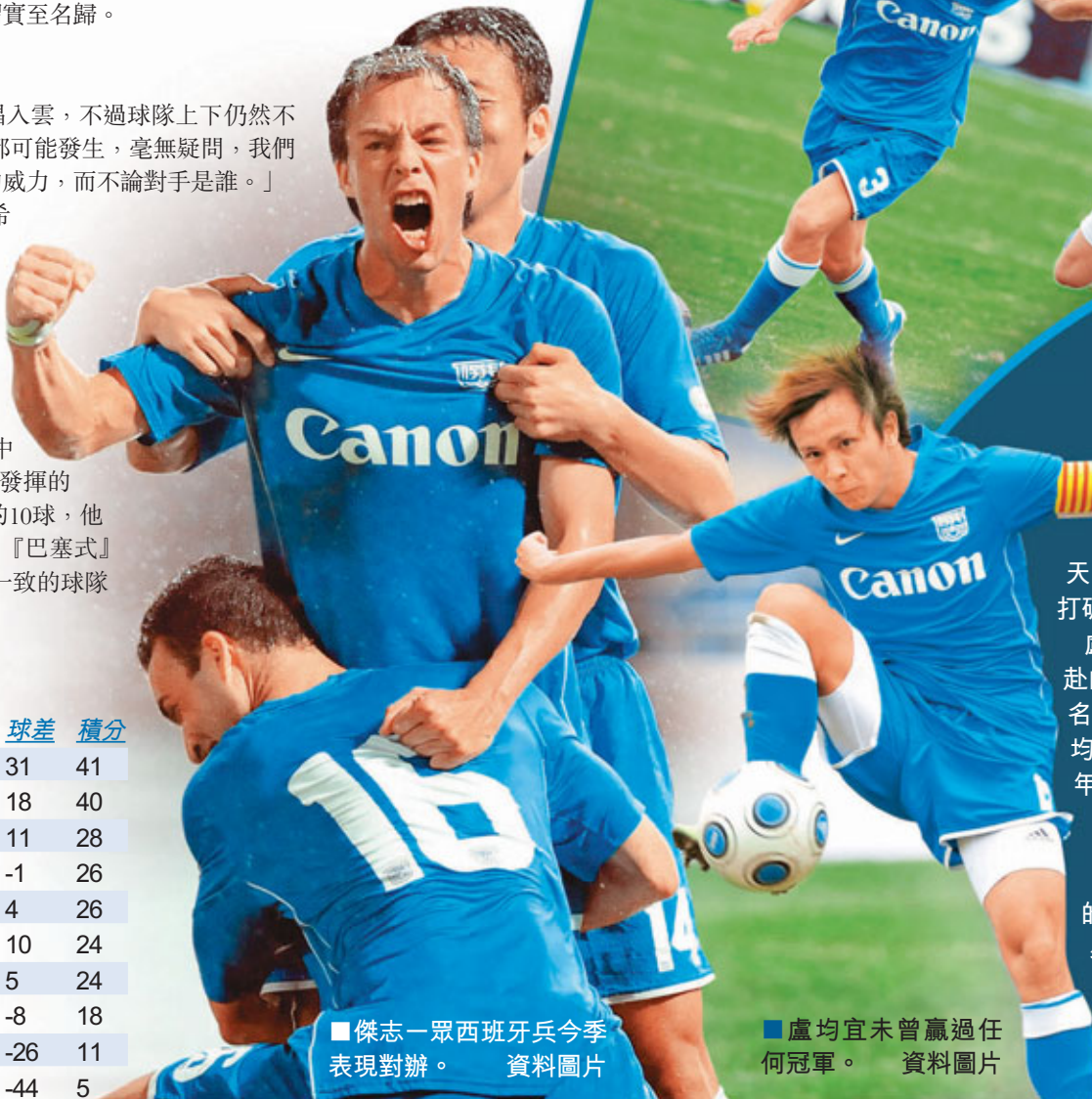
傑志一眾西班牙兵今季表現對辦。資料圖片