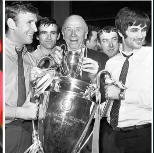
1968年畢士比爵士(中)率領曼聯首奪歐冠盃。