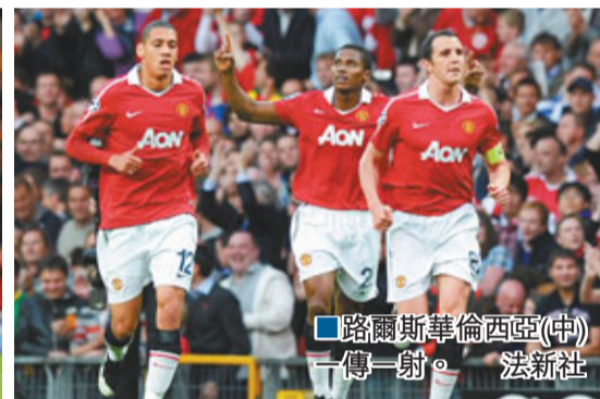
路爾斯華倫西亞(中)一傳一射。