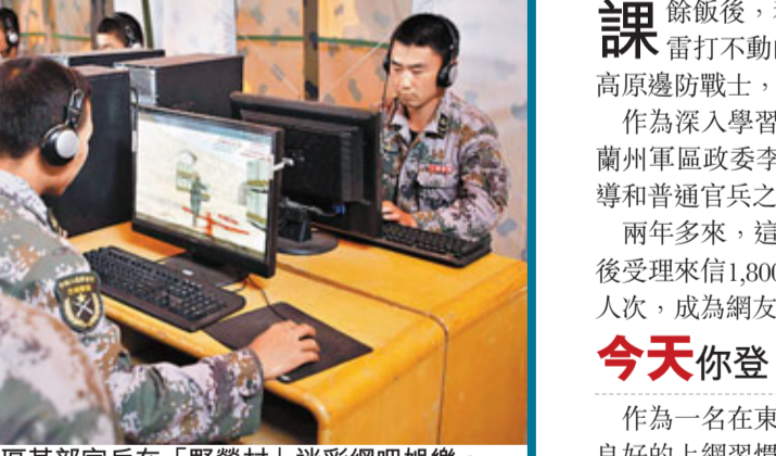
■新疆軍區某部官兵在「野營村」迷彩網吧娛樂。