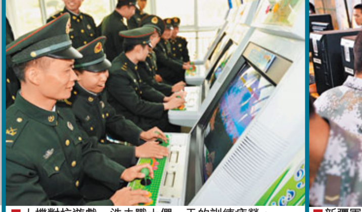
■人機對抗遊戲，洗去戰士們一天的訓練疲勞。