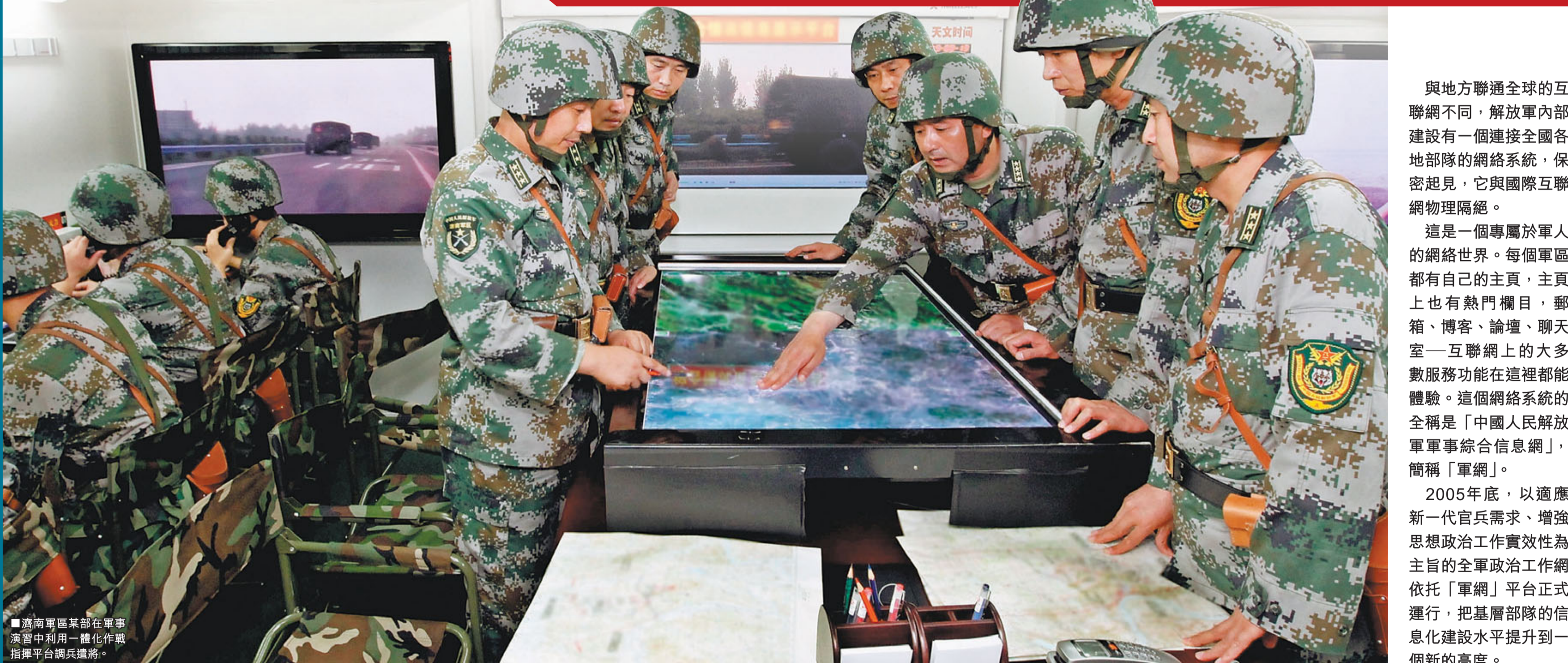
■蘭州軍區某部在軍事演習中利用一體化作戰指揮平台調兵遣將。