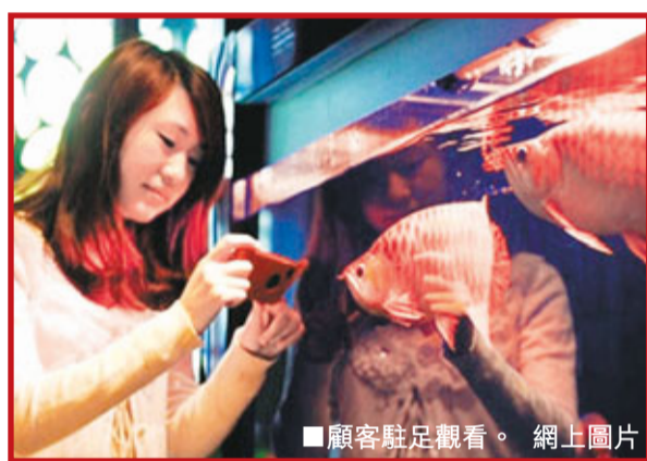
顧客駐足觀看。

日前，四川成都百花西路某魚館內，一條通體紅色的極品紅龍魚，吸引了不少魚類愛好者駐足觀賞。其媲美寶馬車的36萬元天價，更是讓觀者嘖嘖稱奇。