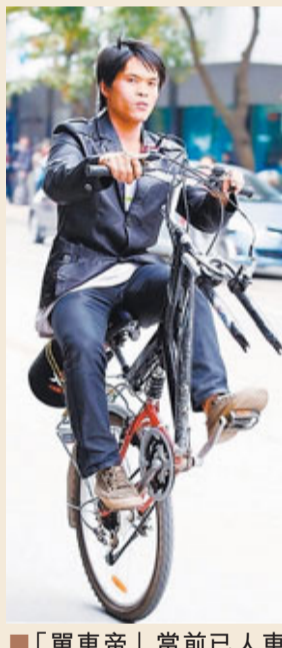
「單車帝」當前已人車合一，嫻熟自如騎獨輪秀車技。 香港文匯報記者張廣珍 珠海真真

香港文匯報訊（記者黃殿晶、張廣珍 珠海報道）珠海曾驚現因成功駕馭無前輪的獨輪單車而爆紅網路的「單車帝」，轟動一時。近日，該「單車帝」首次公開亮相某活動，上演單車特技，引來不少熱捧，他表演完後，將離開珠海，前往深圳發展車友宣傳低碳環保。