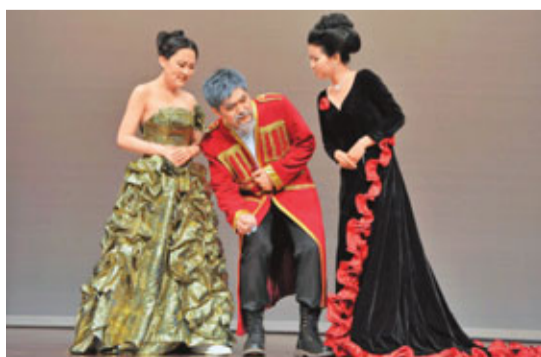
▲來自兩岸三地14間大學的代表，從早前的初賽脫穎而出，本月底將於港中大進行中國大學莎劇比賽決賽。圖為上屆決賽隊伍演出莎士比亞著名戲劇。

香港文匯報訊(記者 高鈺)香港中文大學英文系及藝術行政主任辦公室合辦、田長霖博士科技創新基金會贊助的第七屆中國大學莎劇比賽，將於5月23至25日下午於港中大逸夫堂舉行。來自兩岸三地40間大學參與了是次比賽，包括港中大、香港大學