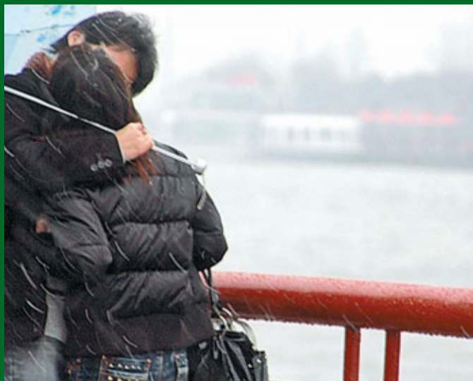
年輕情侶結伴同遊本是平常事。但近日有中介人趁暑期即將來臨，於網上討論區升學專頁留言，招聘「兼職情人」，實質引誘年輕學生從事援交工作。