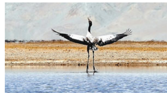
中國投入巨資保護西藏阿里濕地。圖為一隻黑頸鶴在該區境內濕地上覓食。

此外，報告亦指出，大型圍填海、過度捕撈和海水養殖、陸源排污等是影響海洋安全的直接原因。