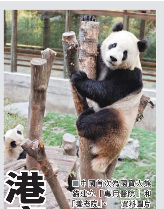
中國首次為國寶大熊貓建立「專用醫院」和「養老院」。資料圖片