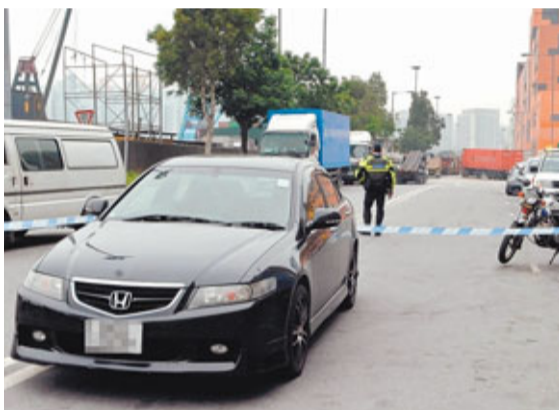
涉藏毒私家車公然在屯門海華路路中央連泊近4小時。

據目擊者稱,2名警員正欲抄牌時,一名青年飛奔而至大叫:「阿Sir,不要抄牌,走啦。」2警見該青年和座駕都有可疑,要求搜查,青年拒絕並發難推開警員,欲駕車逃走,2警制止時雙方發生糾纏,最終青年被警員合力制服拘捕。