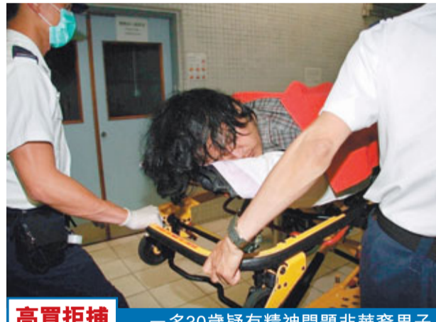
高賈拒捕 一名30歲疑有精神問題非華裔男子Rai,昨午3時許,在旺角廣華街1號地下一間超市涉嫌高賈7罐罐頭,被經理揭發後發難,跨過1米高鐵欄欲逃,附近剛有休班機動部隊警員行經,見狀飛撲上前將其制服,糾纏間2人俱受傷,需送院診治,由於疑人被捕後仍不斷胡言亂語及反抗,送院時要被五花大綁。擒賊受傷休班警員年約30歲,駐守機動部隊E連,其右膝遭撞傷。

警員搜查車廂檢獲少量懷疑毒品,將案交屯門偵緝隊第2隊接手跟進,該車拖返警署扣查。