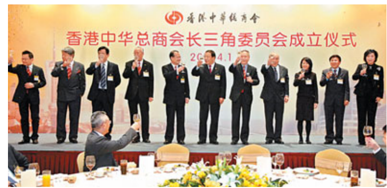
中總在上海舉行該會長三角委員會成立儀式

上海市委書記俞正聲表示,當前上海經濟轉型發展任務很重,上海要學習借鑒香港在服務業、對外貿易發展等方面的經驗,進一步提升上海的現代服務業發展水平。他說,上海與香港的合作一直非常密切,希望兩地進一步互為補充、互為促進,共創更好的互利共贏的局面。俞正聲書記又向中總訪問團介紹了上海「十二五」期間創新驅動、轉型發展的思路和目標,對香港工商界給予上海發展的支持和幫助表示感謝。