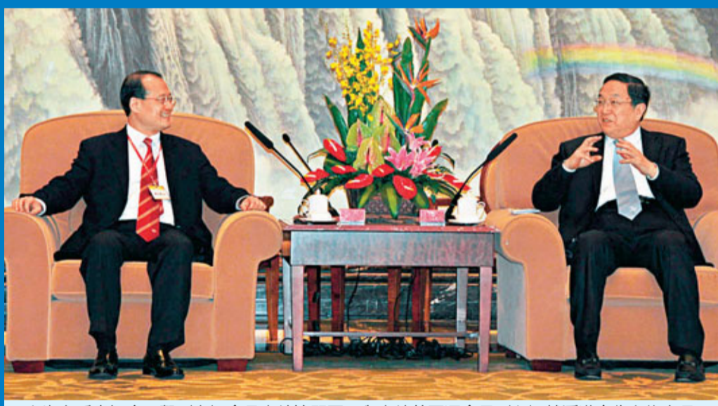
上海市委書記俞正聲(右)會見中總訪問團,與中總蔡冠深會長(左)就滬港合作交換意見。

香港中華總商會會長蔡冠深率該會代表團,日前(3月29日至4月2日)前往江蘇、浙江和上海訪問,就如何推動香港與長三角的合作交流意見。在上海期間,該會與上海海外聯誼會聯合主辦「長三角·香港現代服務業高峰交流會」,並舉行該會長三角委員會成立儀式。