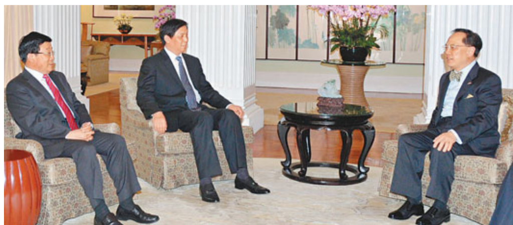
■香港行政長官曾蔭權（右）在禮賓府與貴州省委書記栗戰書（左二）及貴州省長趙克志（左一）就雙方關注的議題交換意見。

曾蔭權對栗戰書、趙克志率團來港招商引資表示歡迎。他說，貴州投資貿易活動周，讓香港各界更加了解貴州的優勢，尋找到投資商機，也能讓貴州企業加強對香港的認識，並加以利用，優勢互補，合力推動兩地經濟發展。黔港合作關係十分重要，雙方在許多領域有着很強的互補性，合作前景十分廣闊。