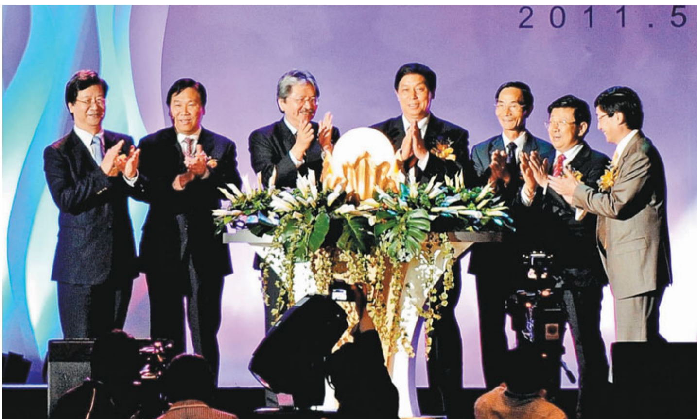
■左起：香港文匯報董事長兼社長王樹成、外交部駐港特派員公署副特派員李元明、香港特區政府財政司司長曾俊華、貴州省委書記栗戰書、中聯辦副主任黎桂康、貴州省省長趙克志和香港貿發局總裁林天福為開幕式啟動按鈕。