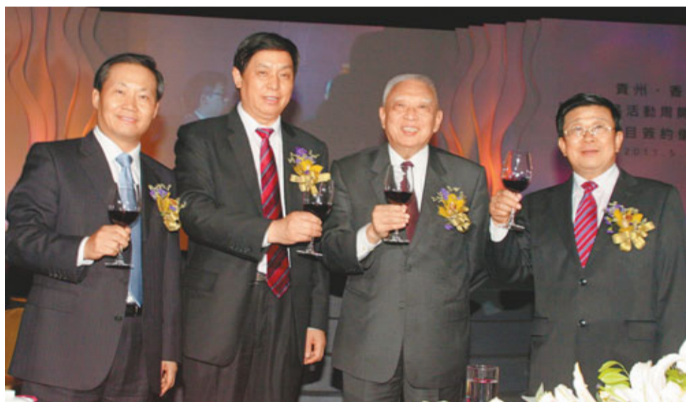
■左起：中聯辦主任彭清華、貴州省委書記栗戰書、全國政協副主席董建華、貴州省省長趙克志出席「貴州·香港投資貿易活動周」晚宴。

香港文匯報訊（記者 卓建安）「貴州·香港投資貿易活動周」開幕式暨項目簽約儀式昨日在港舉辦，率團參加活動周的貴州省委書記栗戰書表示，此次是改革開放以來貴州在港舉辦最大規模的招商活動，貴州希望在能源、礦產、特色工業、農業、城鎮開發、現代服務業、旅遊、金融、人才培訓等方面與香港加強合作。