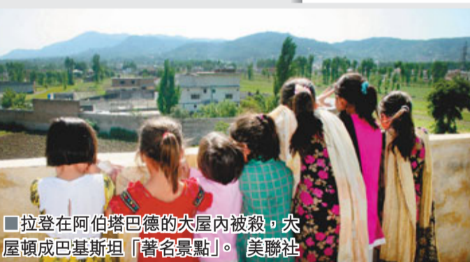
拉登在阿伯塔巴德的大屋內被殺，大屋頓成巴基斯坦「著名景點」。美聯社

美無通報 巴責損關係 巴外交部發表聲明，批評美方事先沒有通報，「這是沒有得到巴方授權的單邊行動，將損害兩國的合作關係，還有可能威脅到國際社會的和平」。聲明稱，美軍直升機利用丘陵地形造成的雷達盲點，採貼地飛行技術進入巴國領空。巴國得悉突襲行動後幾分鐘即派戰機攔截，但美軍已帶著拉登屍體飛離其領空。 ■英國《太陽報》/《每日郵報》/《華盛頓郵報》/法新社/路透社/美聯社