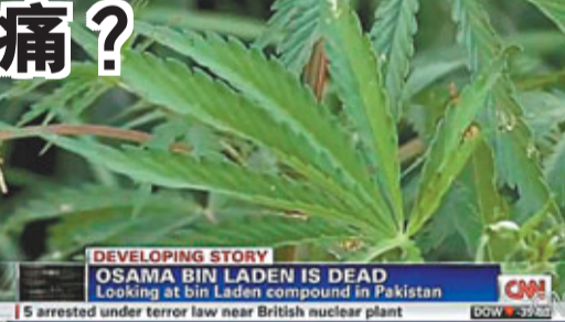
CNN記者發現，拉登大宅外圍種植了數百棵大麻草。

美國有線新聞網絡（CNN）記者實地採訪發現，拉登藏身的大宅外圍，種植了數百棵大麻、椰菜和馬鈴薯等植物，該處距離巴基斯坦軍事學院信步可達。報導稱，拉登可能一直有吸食大麻。據報，拉登近年患有腎病，可靠吸食大麻紓緩痛症。 大宅圍牆寫上女子書院的廣告字句，諷刺的是，拉登一向反對女性接受教育。此外，美國官員估計該幢大宅價值100萬美元（約777萬港元），但當地房地產代理稱，該幢樓房只值25萬美元（約194萬港元）。