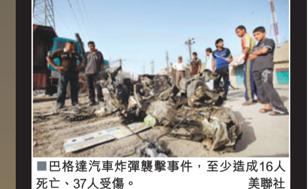
巴格達汽車炸彈襲擊事件，至少造成16人死亡、37人受傷。美聯社

東盟峰會保衛升級 第18屆東盟峰會將於周六在印尼首都雅加達舉行，印尼政府近日提高安全保衛級別，並派出數千名軍警加強巡邏，連總統衛隊也參加東盟峰會各國首腦的安保護衛。 歐洲國家紛紛由拉登遭擊斃的喜訊中恢復冷靜，加強維安措施，保持高度警戒。歐盟反恐協調官戴科喬夫說，所有歐盟國家仍保持高度警戒，警察及其他維安工作人員更不敢大意。在匈牙利訪問的美國國務院官員韋魯德前日說，歐洲不必害怕恐怖分子因拉登之死實行報復，對於「基地」組織會引爆藏在歐洲的秘密核炸彈傳言不必當真。 ■美聯社/路透社/中新社/中央社