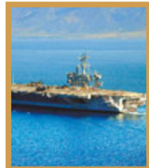
海葬拉登的美國航空母艦