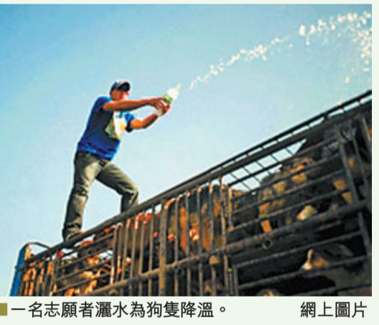
一名志願者灑水為狗隻降溫。