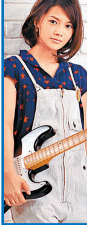
■YUI出道7年，首度來港宣傳。