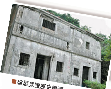
破屋見證歷史變遷

這個自然景點在東平洲南端，垂直而下的峭壁沿海岸線伸展。經過海浪的日久沖蝕，峭壁之下形成了很多岩洞。只有在潮水退至十分低和海面極平靜的情況下，才可從更樓石步行前往難過水。