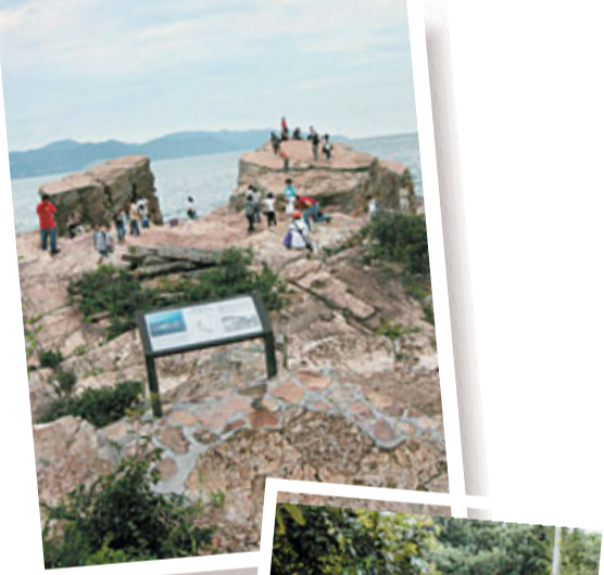
更樓石，在小島東南端的海蝕平台上，有兩座約七至八米高、形狀獨特的海蝕柱。

島上的郊遊徑連接碼頭，起點有數座海邊小屋，沿路尚未荒廢的村屋仍有村民在假日售賣小食、飲料。小村前的海灘由光滑的石卵組成。離開村落，臨海邊之際，沿路有天后古廟(天后宮)及譚公廟，都是島上最具歷史價值的建築物。