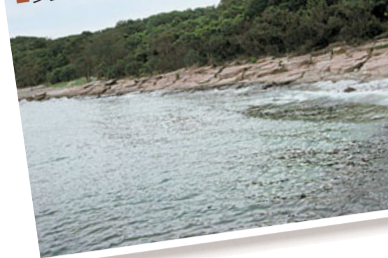
多姿多彩的海岸資源

東平洲位於香港東北面的水域，是大鵬灣中央的一個小島，全島大部分地方都已劃為船灣郊野公園(擴展部分)，而環島的水域更被國土資源部批准成為國家級地質公園，以保護多姿多彩的珊瑚群和海岸資源。整條郊遊徑靠海而行，環繞東平洲一圈，是認識地質公園的不錯選擇。