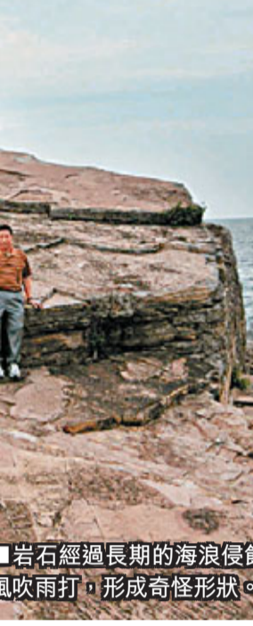
岩石經過長期的海浪侵蝕和風吹雨打，形成奇怪形狀。