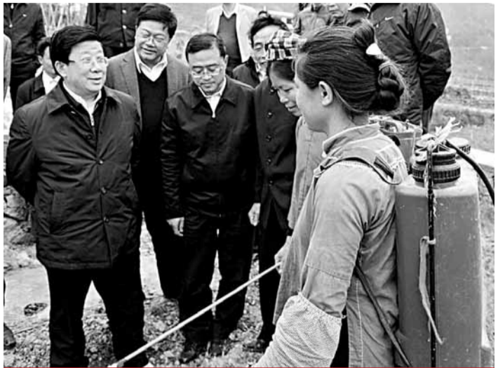
■中共貴州省委副書記、省長趙克志（左一）在黔西南州委書記陳鳴明（左三）、冊亨縣委書記陳國芳（左二）的陪同下深入冊亨早熟蔬菜基地調研，並與布依族農戶親切交談，了解種菜收入。