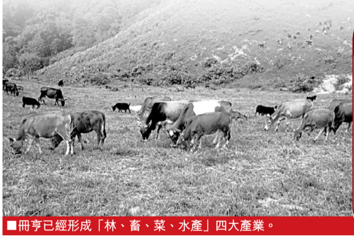
■冊亨已經形成「林、畜、菜、水產」四大產業。