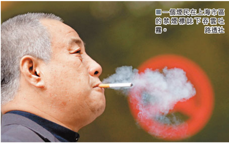
一個煙民在上海市區的禁煙標誌下吞雲吐霧。

1日中午，記者走進一家食府看到，一層大廳內坐滿了顧客，有兩桌顧客邊吃飯邊抽煙聊天，服務員穿梭於各餐桌間，並未對抽煙顧客進行制止。記者坐下後向服務員要煙灰缸，服務員迅速送